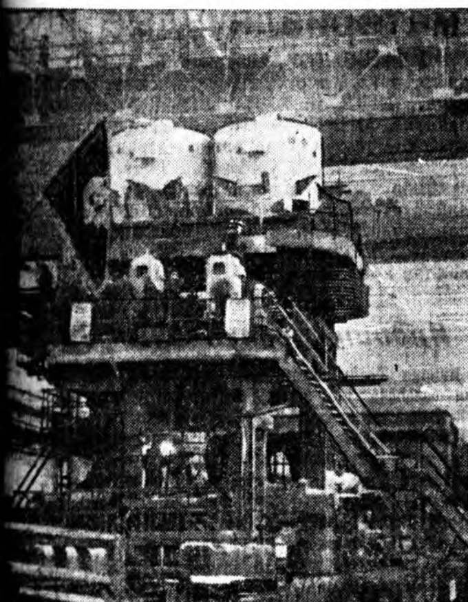
ОБЛАСТЬ Ильичин нэрэмжэтэ Ждановска металлургийн завод хайлган гаргадаг прокатан стан оруулхана байна. Зураг дээр: «1150» тухай

шудхалаагай, бусад түхээрэл-гэнүүд хэльебэн заагдаа. Арадай ажахын бүхы халбаринуудтаа техниксэ дэбжэлтэ ухаалан зохёогшодой, уралан нарижуулагшадай эдбхитэй хабаадгалгатайгаар бэелүүлэгдэнэ. Тэднэр 4 миллион үлүүтэй дурдахал оруулаа. Арадай ажахыда ухаалан зохёолгын, уралан нарижуулгын 2 миллион 800 мянга шахуу дурдахалууд нэбтэрүүлэгдээ. Энэ хадаа жэлэй турша соо абажа үзэбэл, 1,7 миллиард үлүүтэй түхэриг алмаха арга олгоно. Хүдэлмэришэд болон алба хаагшад хүдэлмэрийн үдэрэй богино болгодобошье, ажалай бүтээсэ 1960 онойхидо орходоо 4 үлүүтэй процентээр дээшлээ. Үйлдбэрийн, ашаа шэрлгын, эд бараанай эрьсын дээшлэнэй ашаар арадай ажахыда урдахи жэлэйхиде орходоо 6 тухай процентээр ехэ ашаг олзо оруулагдаа. Америкын Холбоото Штадуудтай амгалан ёһоной экономика мурьсөө хэхэдээ, Советскэ Союз 1961 ондо шэнэ амжалтанууды туйлаа