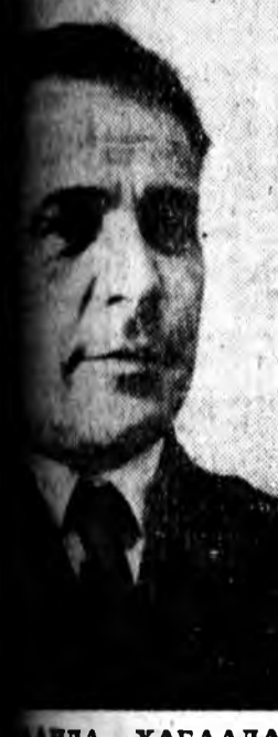
АНДА ХАБААДАГ- Алын аймагт «Улаан элой агитатор С. Л. нов. 2. Прибайка- лтай барилгын хэрэг- түгээрвадхи комби- наркой секретарийн К. К. Бордаенко.

гүүлжэ тухай темэ үзэхэдөө, түүрүү- шын арбан жэлэй туршдаа совхозой ажахы хүжөөжэ түсэбтэй холбоно- нын хэ хонирхолтой байгаа. Ху- рагшадын олон асуудал хураа, энэ гол шухала зорилго бэлүүлжэ хэ- рэгтэ хүн бүхэн өөндөгнөө үүргэ эли тодоор ойлгожо абаа.