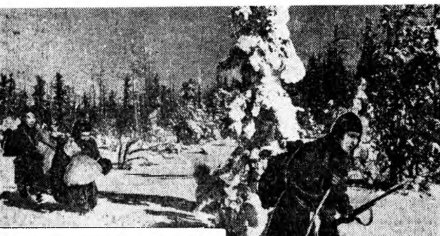
БУРЯТ ҮНЭН 4-дэхи ншоур