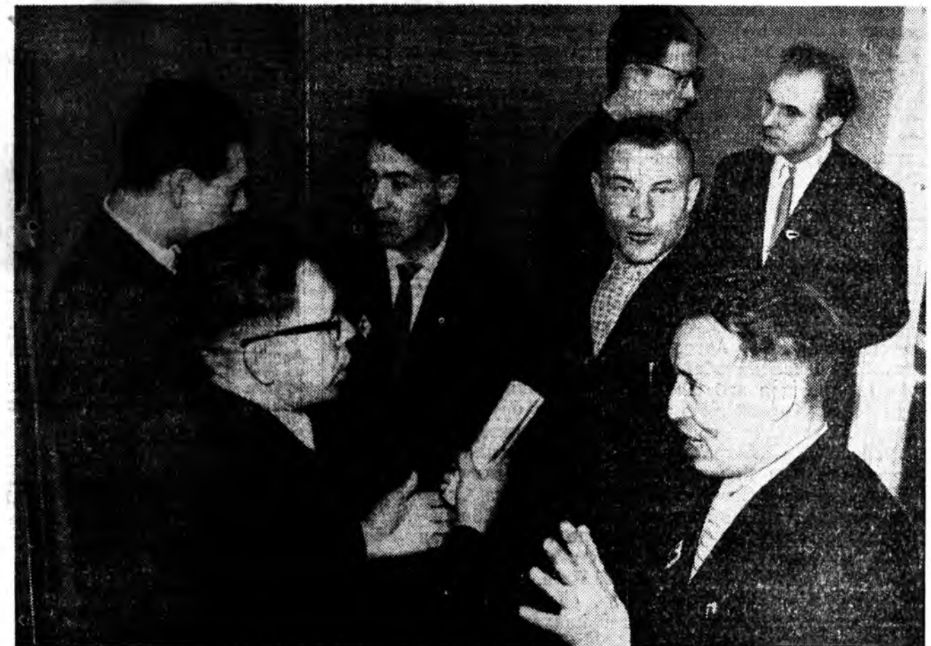
Соёл суртал нэбтэрүүлэгшэдэй республиканска зүблөндэ хабаадаһан нотаг нотагай түлөөлэгшэд дабарлалтын үедэ хөөрэлдэжэ байна.