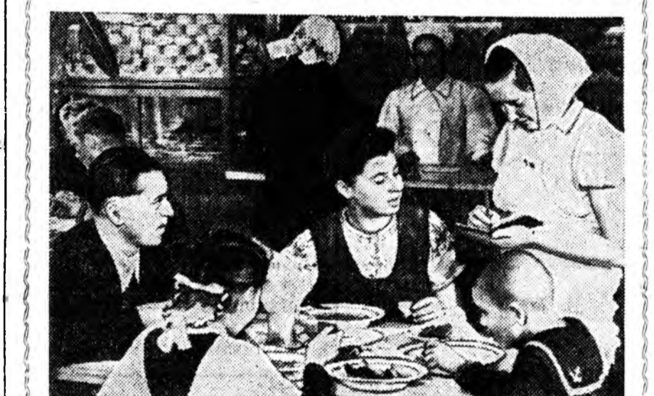
УКРАИНЫН ССР. Волинска областин Локачинска районий Корытица гэжэ тосхойн хүн зонинь культурно-ажайгуула...