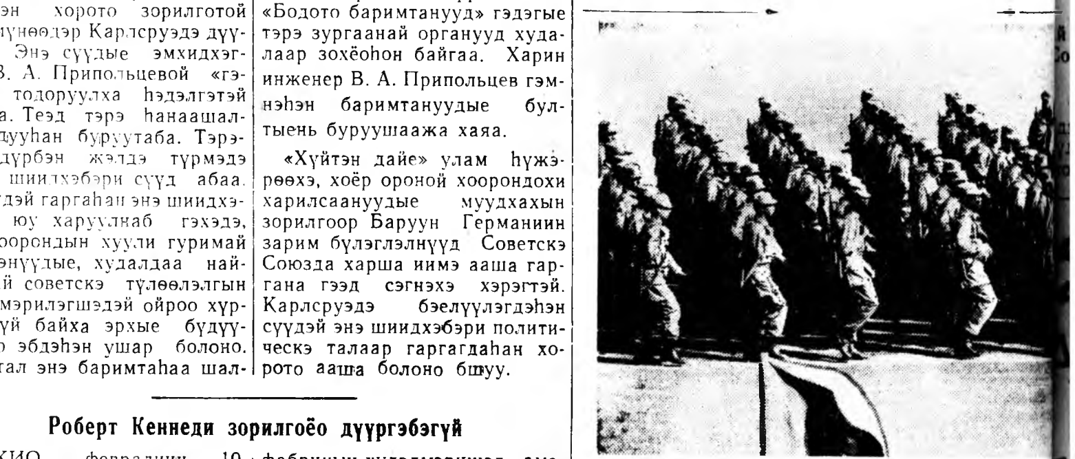
КУБЫН РЕСПУБЛИКА Гаванадахи зэбсэгтэ хүсэнүүдэй подразделени.

«Зүүнэй үзэл центр» гэдгыне нюуса далдын дэлмэришэн англиан арадай эгээл бие нэгэдүүлжэ коммунистическэ сэхээр элишээдэ.