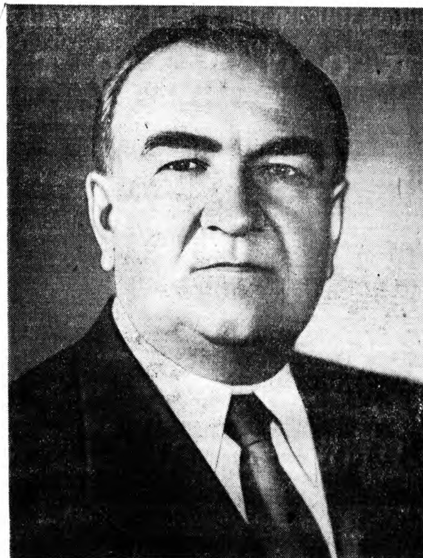
гаалгын бүхэлэлтэнүүдые бодолгодо элэбхитэйгээр харабаадсалдаг, Москвае агаарые хүтэлбэрлэдэг байгаа.

1938 ондо Москвагай ажалшадай депутатуудай городской Советэй гүйсэдкомой түрүүлэгшын орлогшоор һунгадһаа һэн. Эсэгэ ороноо хамгаалха Агуухэ дайнай үедэ Москва хото шадар хам-