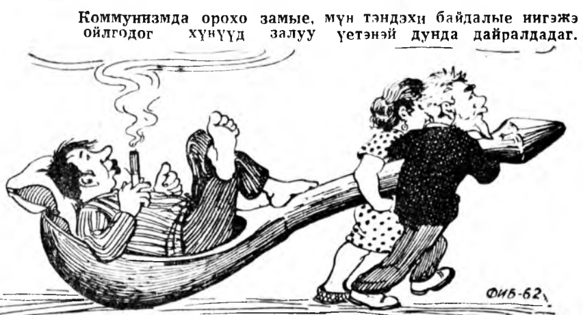
Коммунизда орохо замые, мүн тэндэхи байдалые нигэжэ ойлогдог хүнүүд залуу үетэй дунда дайралдаг.

«Эмы, абын буянгаар Эрмэг гуталаа элэнгүй, Ой ухагаа зобонгүй, Одоо жаргалай орондо эрэхэб. Эдикэ түлөөгүйгөөр, Уухаб зобонгүйгөөр, Хубсалхаб миинтээр, Хобуушлхаб хорилтогүйгөөр. Имэ сагай эрэхэдэ Эльгээ хатажа амархаб, Гүзэгээ барьжа хүжихэб. Хэнэй ашаар?—гэз наань, Эмы, абын «ашаар гэхэб».