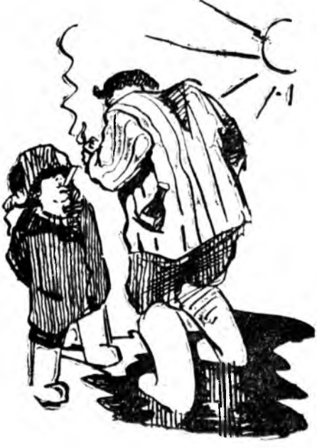
— Тамхяа аһажа болохо гү?