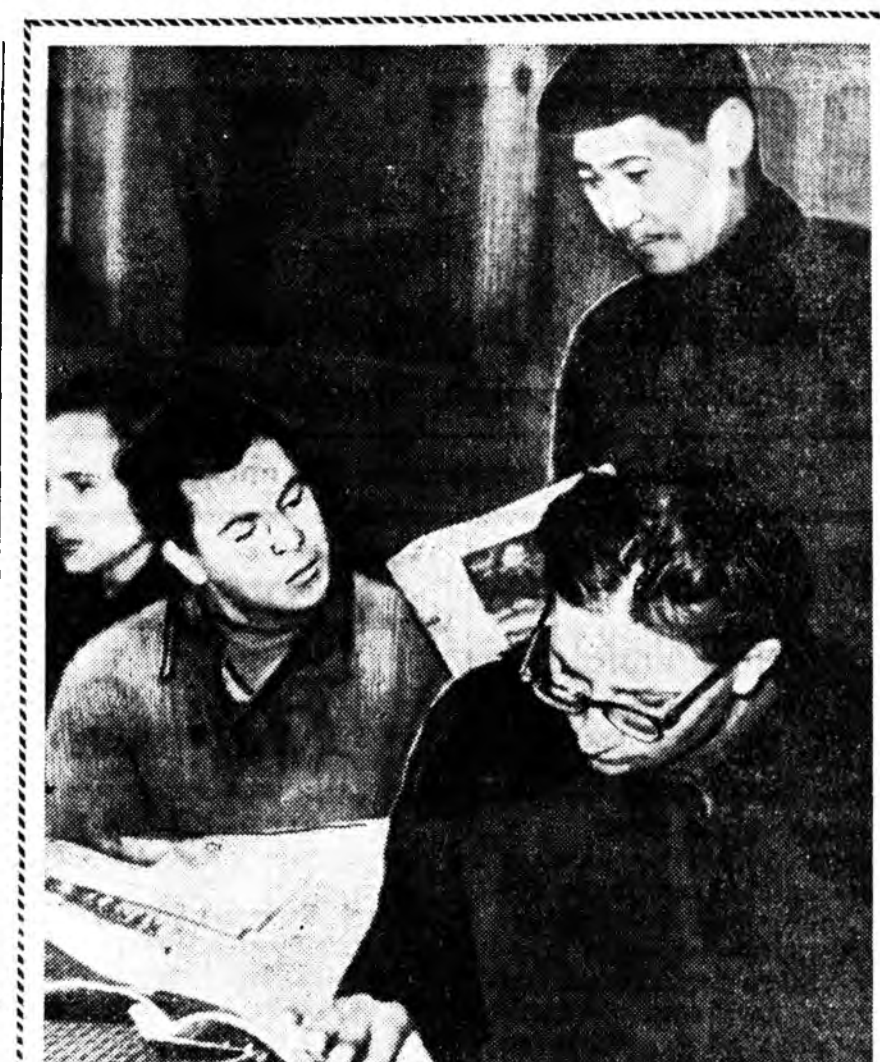
Улан-Удын барилгашадэй клуб дээрдэ амхидхэгдэһэн агитпункт соо хунгалтад ажалтайнгаа һүүдэр сугларжа, шэнэ газет болон журналнуудые уншадаг, һонирхолтой хөөрлөгүүдые шагнадаг. Зургад дээрэ: хунгалтад сүлөө сагаа агитпункт соо үнгэрэнэ.

ИВЗ-эй ЦК-гэй энэ Хандалгада харюу болон, манай республикын ажалшад СССР-эй Верховно Соведэй болохо байһан нунгалтые коммунист байгуулагын алыше хайбарни дээрэ худалдахо ажалтай эрхим ажалгаар утажа, коммунистууд болон партиинабшэ хүнүүдэй бата нэгэдэлэй кандидатудай түлөө нэгэн ханалтайгаар, нэгэ хүн шөнөгөөр дуугаа үгэжэ байна. Ингэжэ Коммунистическэ партиингаа түлөө, ИВЗ-эй ХХI сьездын түхэтэй шидхэбэринуудые бэлдүүлхын түлөө бүгэдөөрэн дуугаа үгэхэ юм.