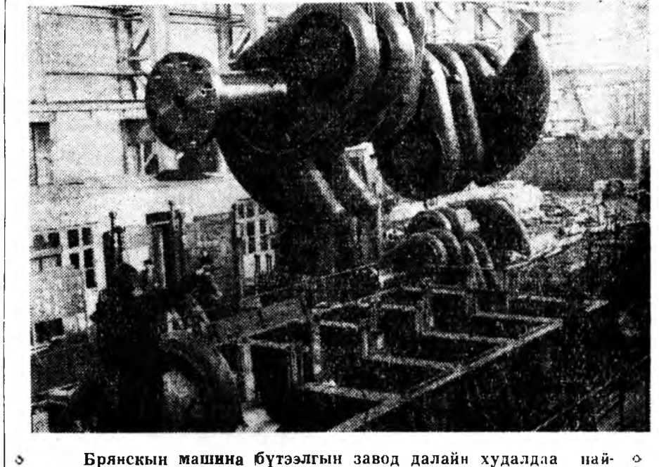
Брянскын машина бүтээлгын завод далайн худалдаа наймаанай флотто зориулан, юэһ болон таба мянган моринной хүсэтэй эрьсэ үсөөнтэй дизельнуудые мүнөө жэлдэ бүтээжэ үгэхэ ёһотой юм. Дүрэн нимэ дизель хабсарлага эхилээ. Зураг дээрэ: 9 мянган моринной хүсэтэй дизелин нуури болоһо рама дээрэ 47 тонно шагүүртэй колечнэтэ валай секци тохдожо байна.

Суглаанда хабаадагшад 1962 оной социалис уялгануудые баталан абаба.