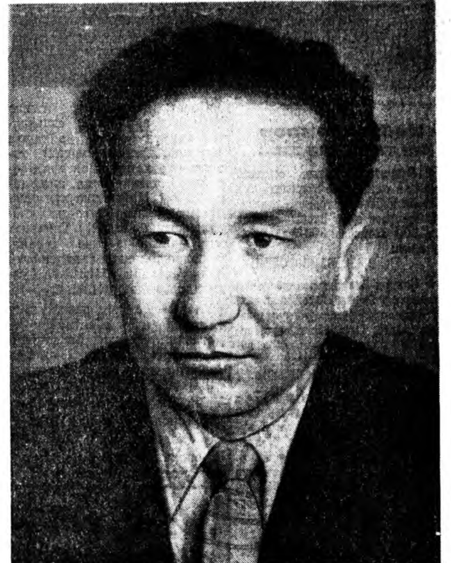
Хүдөө ажыхы бүри найнаар хүтэлбэрлэх тухай Пленум дээрэ зүбшэгдэжэ байхан дурадхалууд айхабтар ехэ удаха шанартай.

1960 оной декабрь. Зэдэ гол маран бутүүрэнги. Арба гаран жэлэй урда тээ хүдөө ажыхын институуды дүүргэжэ, ветеринари врачын нэрэ зэргэ абаад, республикингаа холын аймагуудай нэгэн — Закамелда хүдөө ажыхы түрүүшынхэ ерхэн харгынын... Тээд газар дайдын дунхан танил, түрэнһэн нотаггаань өөргүй.