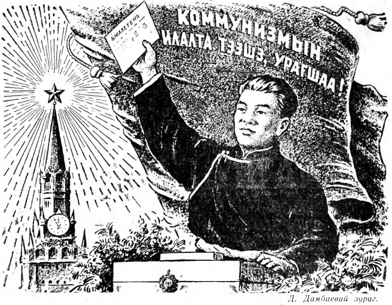
Д. Дамбаевай зураг.

(Советскэ Союзай Коммунистическэ партиин Центральна Комитедэй Хандалһаа)