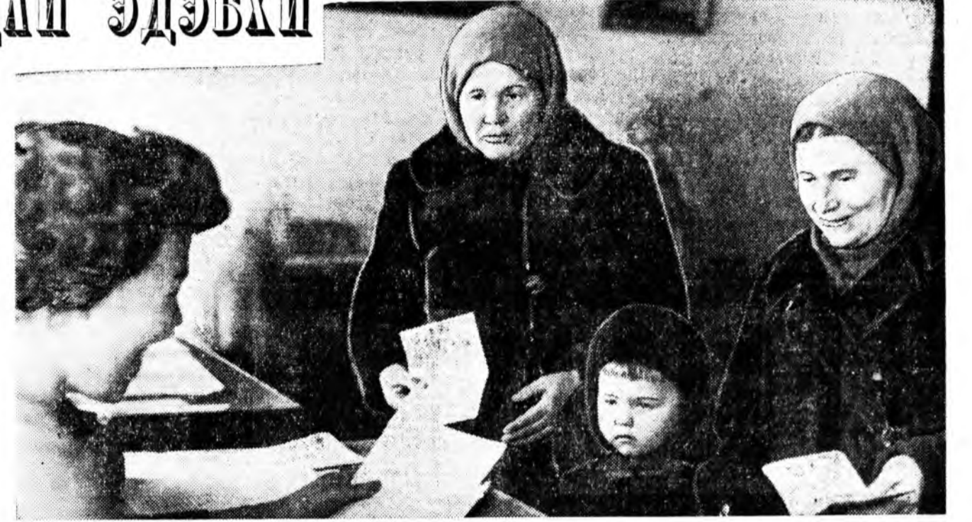
Улан-Удын железнодорожно районной № 11 хунгуулин участогта хунгаад дуугаа үгэжэ байна.

Түмэр замшадый клуб. Байшангай нуур таладань «КПСС-тэ алдар соло!» «Орожо хайрлагты, айлашан ёшоор угтанабди!» гэжэ бэшгэдэһэн аржатар томо үгэнүүд хүнийн харанхыда элдэ язын галнуудаараа холонготон харагдана.