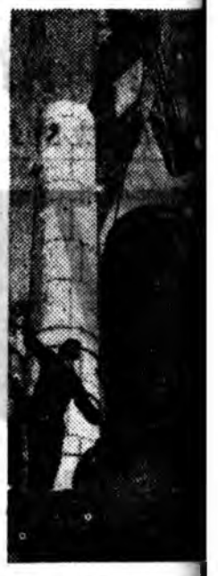
СТАВРОПОЛИИИ Ехэ химичи предприти Невинномиссское заводой туги мун ашаглалдай байна. Орёо нарын болон аргегдууд туршалгануудыг туги. Ставрополиян гааһаа нилээд гү түрүүшын азотной ионийн нэгэн хүриг гоо хүдөө ажахыд рилго заводой колдрилгад болон үр урда табигхай. Николай Кокочев, ревякын, Евгений вой, Иван Шовкунууд социалист мурруу һуури ээлжэе РАГ ДЭЭРЭ: Викторьн бригаданы гаскотелье-утилизаторжо байна.