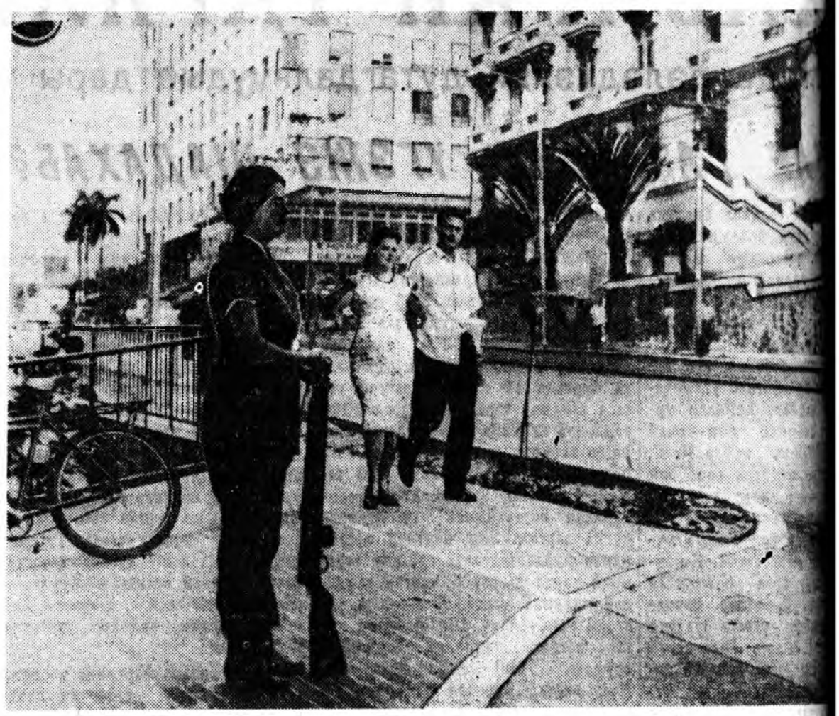
КУБЫН РЕСПУБЛИКА. Арадай милициин эхэнэр-сэрэгшэ Гаванын үйлсэнуудэй сожо байна.

ДЕЛИ, апрелин 9. (ТАСС). Мүнөөдөр үлгөөгүүр эндэ Индин шэнэ правительствоын бүридэл тусхайта ёһоор сонсохгодобо. Джавахарлал Неру премьер-министрээр гурбадахая томилогдобо.