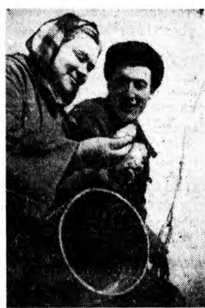
КПСС-эй XXII съездин шиндхэ... ЗУРАГ ДЭЭРЭ: техник геолог...