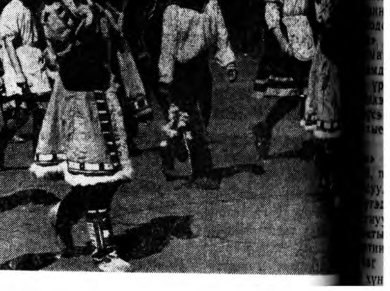
Майн 1-нэй парадта

Бүгдэннитээрэ буу эзбсэг хуряаха ба эб найрамдал бэхижүүлхэ асуудалаар байгша оной июль һарада Москвада болохо Бүхэдэлхэйн конгрессэй үргэн түлөөлэлгэтэй байһыень хараадаа абажа, буу