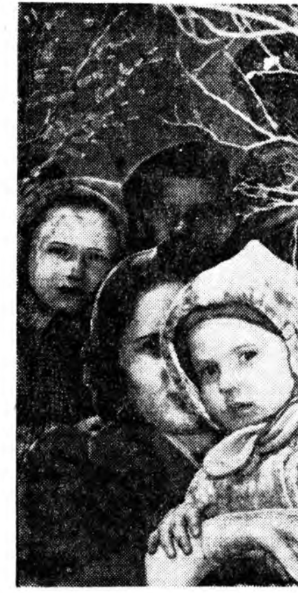
Майн һайндэрэй жагсаалда гарагшад

Үглөөнэй 11 час болохын байшангай урдахи трибуна дээрэ республикымнай партийна, советскэ хүтэлбэрлэгшэд, СССР-эй, РСФСР-эй, Бурядай АССР-эй Верховно Советүүдэй депутатууд гаража, ехэ жагсаалай захалһан тухай һур жабахалта хүгжэмэй аялга эздэлшэбэ. Улаан-Удэ үдээн хүлээгдэнэн сагнай тулажа, түб хотын ажалшаддай демонстрацине гэгээрлэй министрствын, мүн тухай һуралсалдай һургуулинууд нээбэ. Ленин багшынгаа мантан томо дүрэ зураг урдаа баринһан, шад улаахан галстугуудые үбсүүн дээгүүрээ надуулан, согтой хүхюун үхибүүд, шууюур эртэшэ шубуухайнууд шэнгээр агаар ханхинуулан талмай дээрэ гаража ерэнэ. Хонгорхон шарай, хурсахан нүдэндөө баярай ошо сасарган, хүхюүтэй доруунаар алхалалдана. Эдэмнай булта нэгэдэхн һургуулини һурагшад гэшэ.