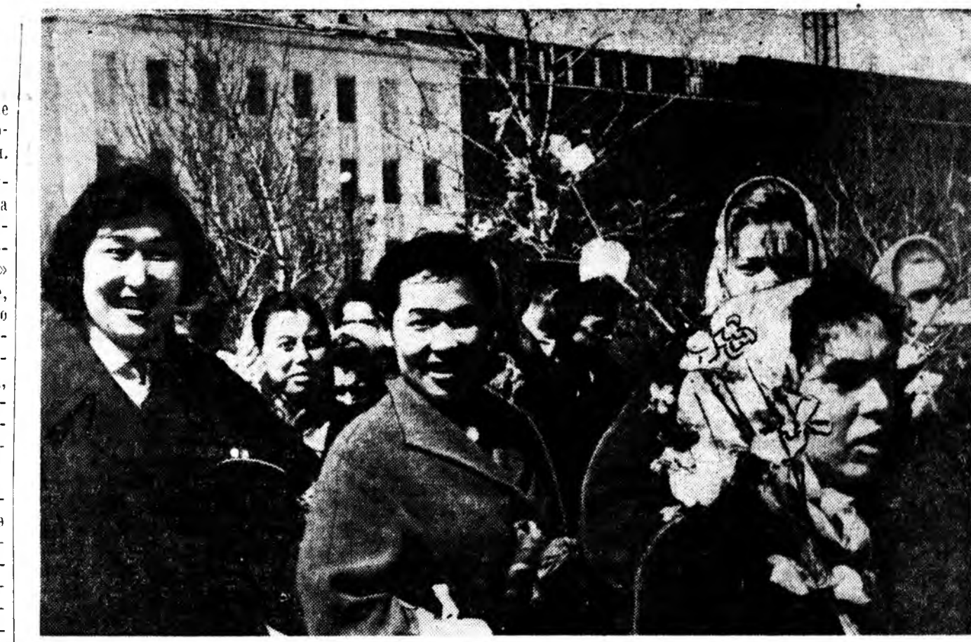
Сэлэнгэ мүнэнэй бусалан урдан мэтэ агууехэ Майн 1-нэй үдэртэ манай Улан-Удын залуушуул Лениний нэрэмжэтэ гудамжаар ябаба.