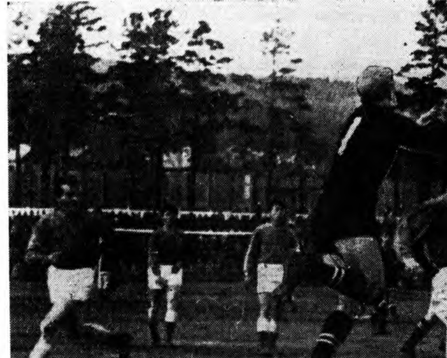
Нааданай халуун үе.