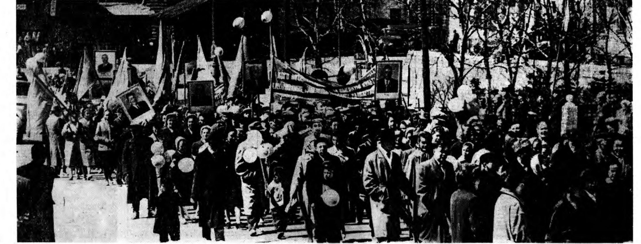
Ажалшадай Уласхоорондын хайндэр — Майн Нэгэниэ Улан-Удэдэ хайндэрлэлгэ.