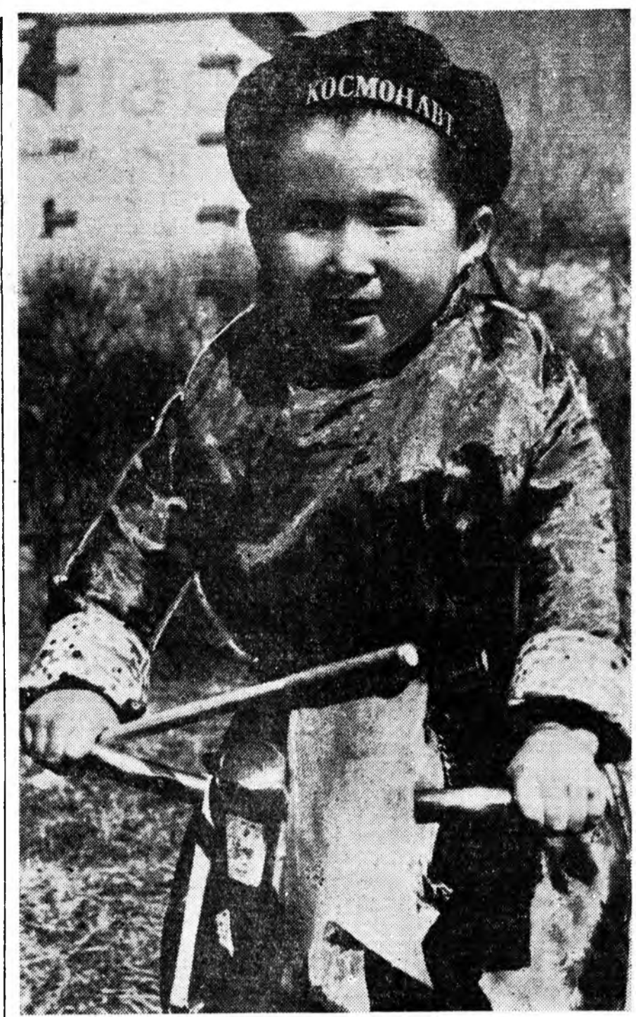
Эрээдүйн космонавт парадта.