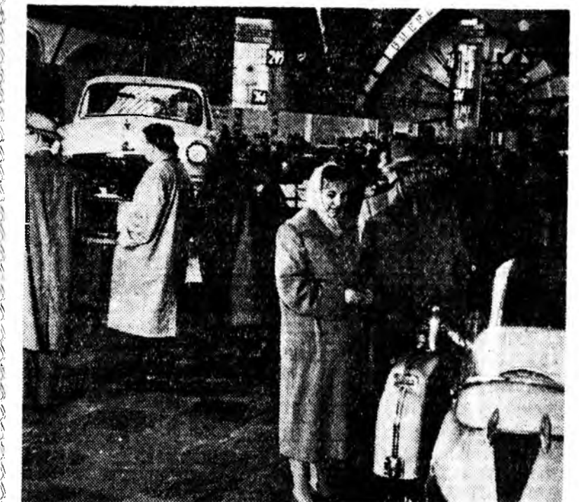
МОСКВА. СССР-эй арадай ажахын амжалтануудыг ха- руулан выставкэ нээгдэбэ. Павильонуудайн олонхи экспона- тууд шэнэлэгдэбэ. Зураг дээрэ: «Машина бүтээлгын» па- вильондо. ТАСС-эй фотохронико.

КОЛХОЗ ХООРОНДЫН ФИБРОЛИТОВА ЗАВОДУУД Колхоз хоорондын ехээр оньһожоруулагданхай фиб- ролитова дүрбэн завод Ви- тебскэ областьдо баригдаа.