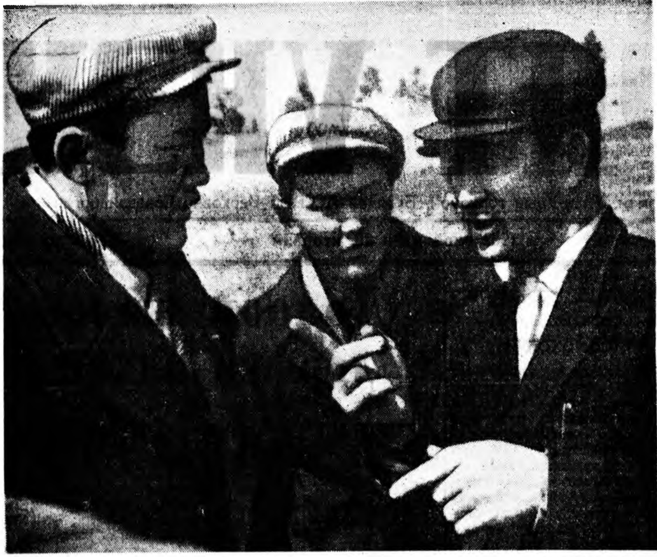
Гахайн мяха ехээр абахын түлөө