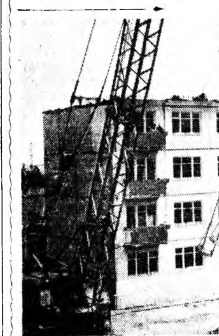
КРАСНОДАР. Городон Октябрьска райондо шэнэ аргаар дүрбэн шардагтай байрын гэр тон богонихон болзор соо, арбан үдэрэй туршада баригдаба.

Энэ университетде дүүргээн дээдэ мэргэжэлтэй хэдэ зуугаад хүнүүд республикын арадай ажаахын элдэб налбаринуудта мүнөө амаллаа байна.