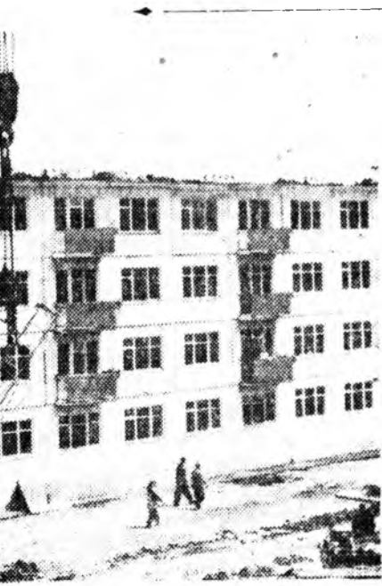
КРАСНОДАР. Городон Октябрьска райондо шэнэ аргаар дүрбэн шардагтай байрын гэр тон богонихон болзор соо, арбан үдэрэй туршада баригдаба.

Яхадэй эрдэмтдээ, университетэй багшанаартаа энэд миил гурбан хүнэй нэрэ дурдагдаба.