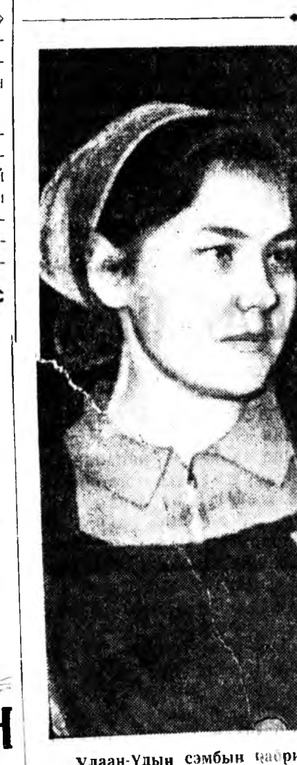
Улаан-Удын сэмбын театрын хүдэлмэришэн, комсомол басаган...