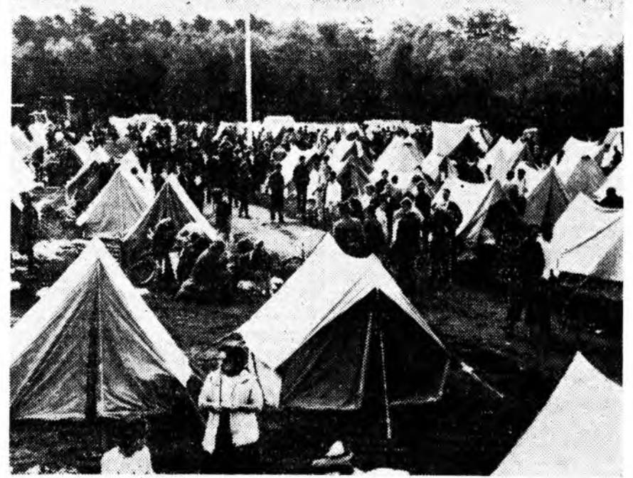
Ядерна эзбсэгүүдэ бэлдэхэ, эдэниие туршаха ябадалы Голландин ажалшад буруушаана. Орон дотор жагсаад, митингүүд үндэрлэдэ, эб найрамдалай аяншалга эмхидгэгдэнэ. ЗУРАГ ДЭЭРЭ: эб найрамдалай аяншалгада хабаадагшад.

выставкэ И АККРА, июлин ий корреспондент мэдээсэ: Советскэ худалдаа най-промышленна ехэ Ганын Республикэдэ үсэгэлдэр «Советскэ правн делегациин то Би СССР-эй Гадаадын наймаанай министр шо Б. А. Борисов Министруудэй Со рүүлэгшэ Н. С. амаршалгын бэшгэ СССР Гана хоёрон нуудай арадуудай хани ёһотой харилжөөлгэдэ тус вис хубита оруулаха амаршалга соонь Иигэжэ Советскэ хоёрой хоорондох наймаанай, экономик рилсанууд сааша жөөгдэхэ. Ганын президент Нкрума выставкэ лолой үедэ үгэ хэлэ выставкын эмхидгэ ехэ баяртайб. Эрдэ техникын талаар Союзай туйлаһан Ганын арал харам ломжотой болобо дент тэмдэглээ. Элдэб техникскэ наймаанай хэлсэнүүд биднэр Советскэ туһаламжа абаады һаламжын түлөө правительствын зоной нэрлээ бар гэжэ Нкрума үргэл Улаалуулан Кван выставкэдэ табигда надууды харбаа. правительствена гшэ гшүүд, олон айлш мые үлшэжэ яба. И дэ ерэнэн хүнүүд жаа бэшэдэг дэбтэ ма тон түрүүлэн тд выставкын эмхидгэ луунаар дэмжэһэ Квеме Нкрума бэш тавкэдэ үндэр сэгнэ