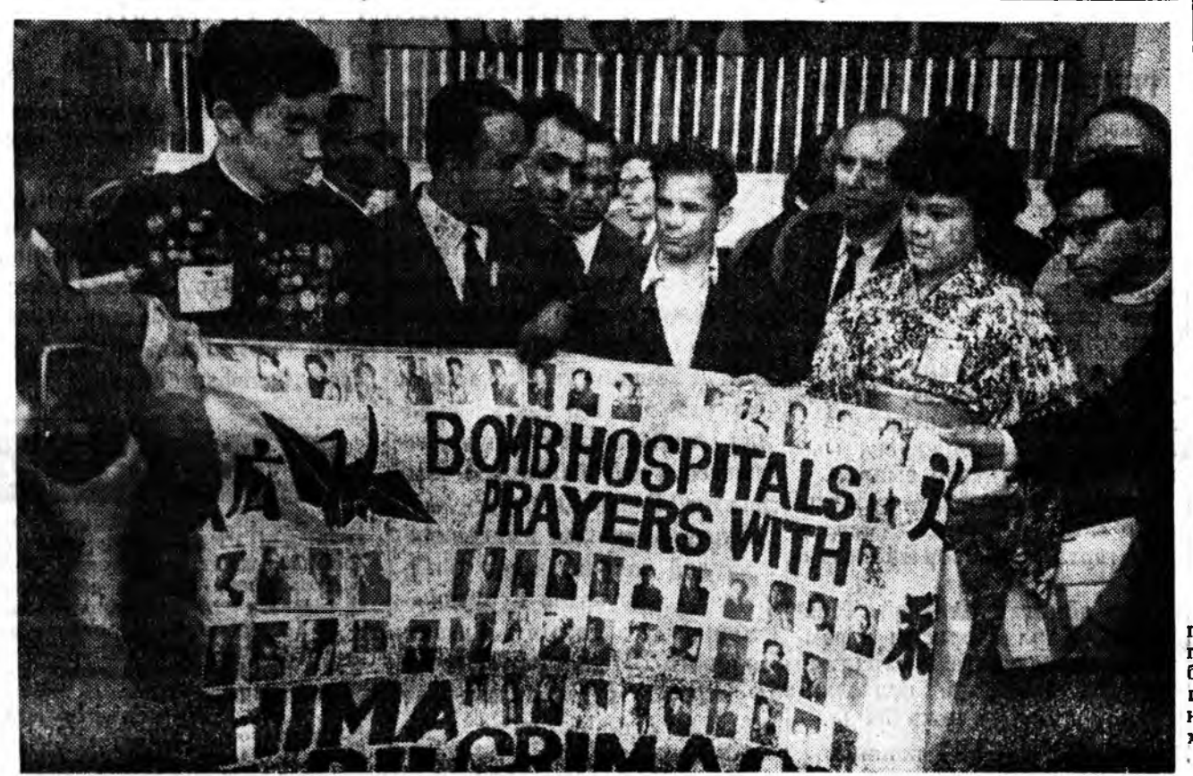
МОСКВА. Бүхэдэлхэйн конгресс. Зураг дээрэ: Хирсимаа городской түлөөлэгшэд атомна бомбодолгын хохидлодо орогшодой дурэ зурагтай плаката-нуудые конгрессэй гашуудтэ харуулжа байна.