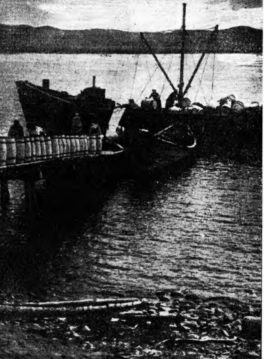
Байгалай заһаһаад хахад жэлэйнгэ түсэб амжалтатгаар дүүргээ. Зураг дээрэ: омолод баһалха боошхонуудэе заһаһаадта эльгээжэ бэлдэхэ байһан үе.