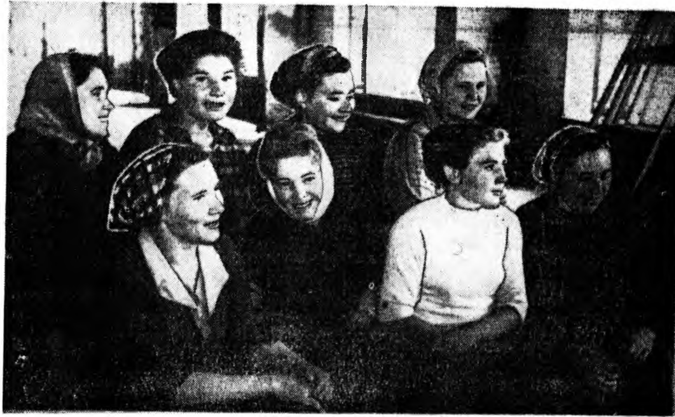
Улаан-Удын ноһоо угаха бригадын нэрэ зэргэдэ хүртэһэн фабрикын барилга дээрэ эрхимээр хүдэлмэрилжэ, коммунист ажалай гэшүүд ажалынгаа забһарта.

Долоон жэлэймнай дорюун алхам жэл эрэхэ бүри эршэ ехэтэйгээр урагшаа дабшана. Гансахан манайшы республикын арадай ажарын һалбары бүхэндэ шэнэ шэнэ амжалта туйлагдана. Илангаяа барил-гын хүдэлмэри город, хүдөө нотагуудташы үргэн далай-сатайгаар эрхилэгдэнэ.