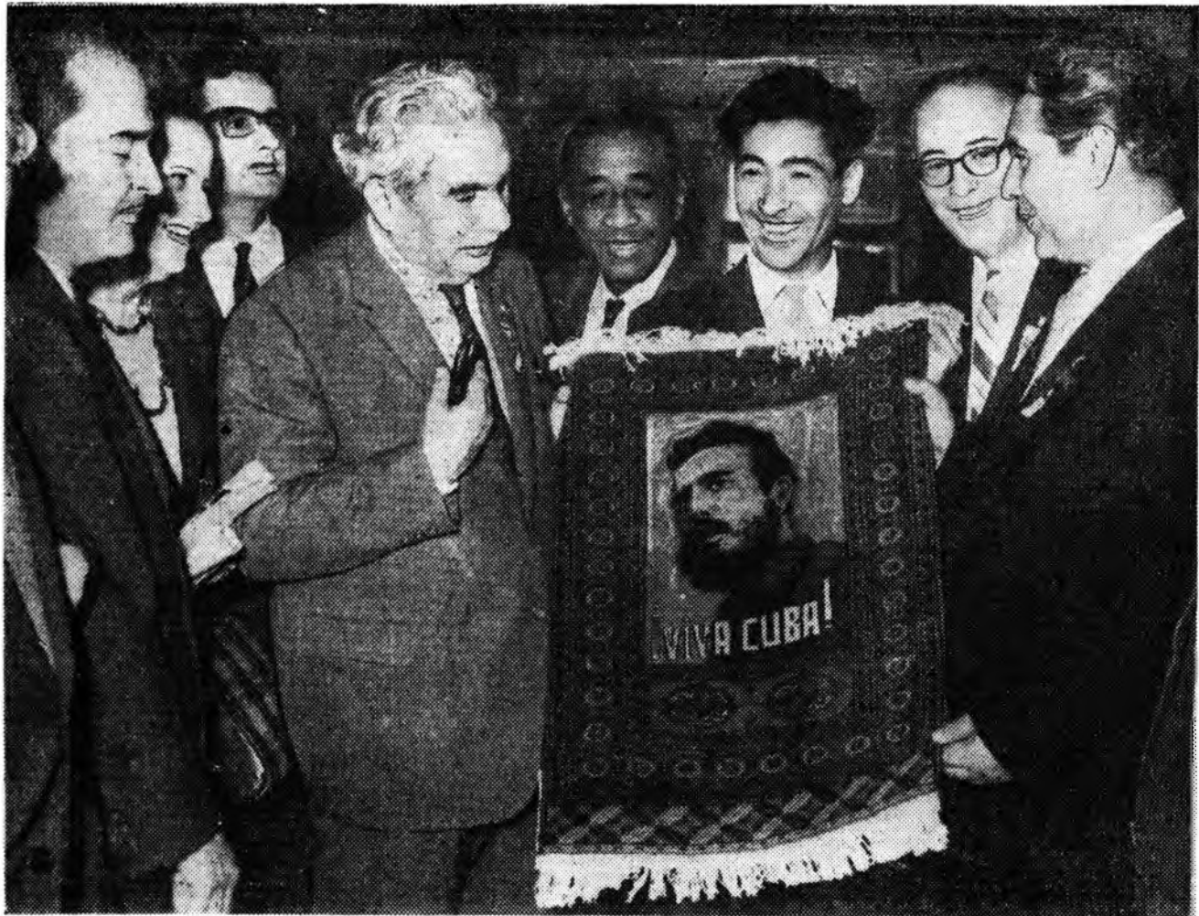
МОСКВА. Ковёр оёдог Туркменин мэргэжлэтэ Аннагач Реджепова Джума нүхэрэйгөө зурагаар багахан ковёр Фидель Кастро гэдэгэй портретыг уралан оёбо, Тингээд тэрэнээ Ку-

бын национальна геройдо бэрлэгдэх гэжэ шиндээ. Зураг дээрэ: гадаадын оронудтай хани барисаа, соёл культурын харилсаа холбоо тогтоохо Туркменин бүлгэмэй президумзэй