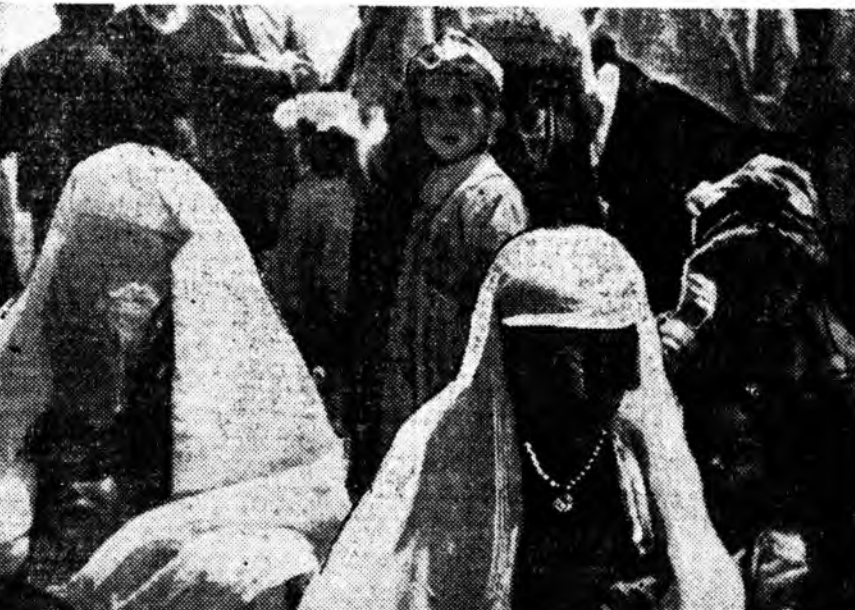
Алжирай бээ даанхай байдалтай болошон тухай сонсоходо. Алжирай арадай колониализмад эсэргүү тэмсэл илалтаар дүүрбэ, Францин колониаторнуудай зэриг муухай аша гаргахата тэрбедэжэ, хүршэ гүрэнүүд тээшэ ошоон хүнүүд найман жэл шахуу үргэлжэлэн дайнай нүүлээр эхэ ороноо буужа байна. Колонизаторнуудай хорото аша гаргахата тэрбедэжэ гарган үбэдэ, эхэнэрүүд, үхибүүд суугарһа. Алжирай хил дээрэ сугларһа. Энэнь зураг дээрэ харуулагдана.

Гвантанамо гэдэг Америкын далайн сэрэгтэй бааза тээһээ Кубада эсэргүү хорото ашанууд ходо гаргагдажа байдаг гэжэ министрство мэдээсэбэ. Тингээд июлин 10-һаа 12 хүртээр Америкын сэрэгүүд Гвантанамо баазһаа Кубын газар руу шэглүүлжэ, 114 дахин буудабэ. Иигэжэ министртын мэдээлэл соо заагдана.