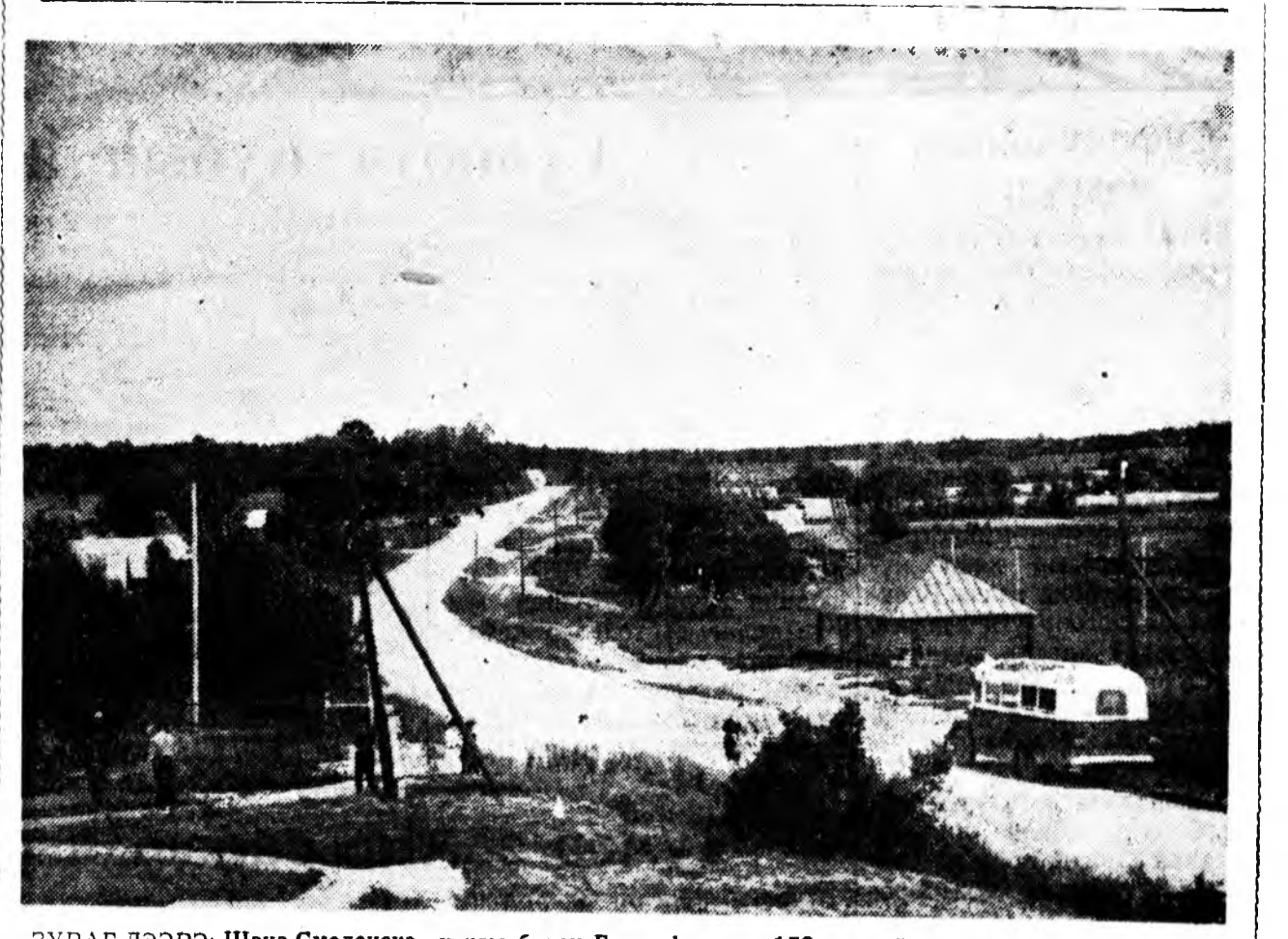
ЗУРАГ ДЭЭРЭ: Шэнэ Смоленскэ харгы болон Горки нуурин. 150 жэлэй саада тээ энээгүүр Наполеоной арми Москва тээшэ довтолон гараа хэн.