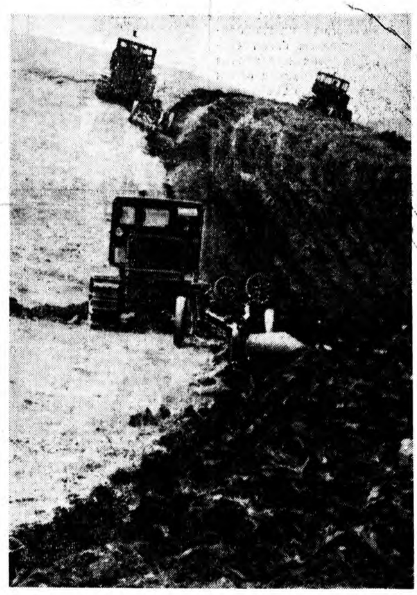
Хурбын совхозһоо ерһөн бэшгүүд

Хүхэд Карлос Оливарес Санчесай, Ф. Р. Козловтой үгэ хэлэжэ байхада нэгэнтэ бэшэ алыга ташалганууд болоо. «Хрушев, Фидель Кастро—ходооо хамта!»—гэһэн юрөөлнүүд табигдаа.