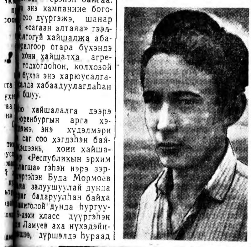
Хонидыг ороондо табихада эгээл таарамжтай саг бүхы эхэ хонидоо гансал искусствена аргаар үрэжүүлэе.

Хонидыг ороондо табихада эгээл таарамжтай саг бүхы эхэ хонидоо гансал искусствена аргаар үрэжүүлэе. Хонидыг ороондо табихада эгээл таарамжтай саг бүхы эхэ хонидоо гансал искусствена аргаар үрэжүүлэе.