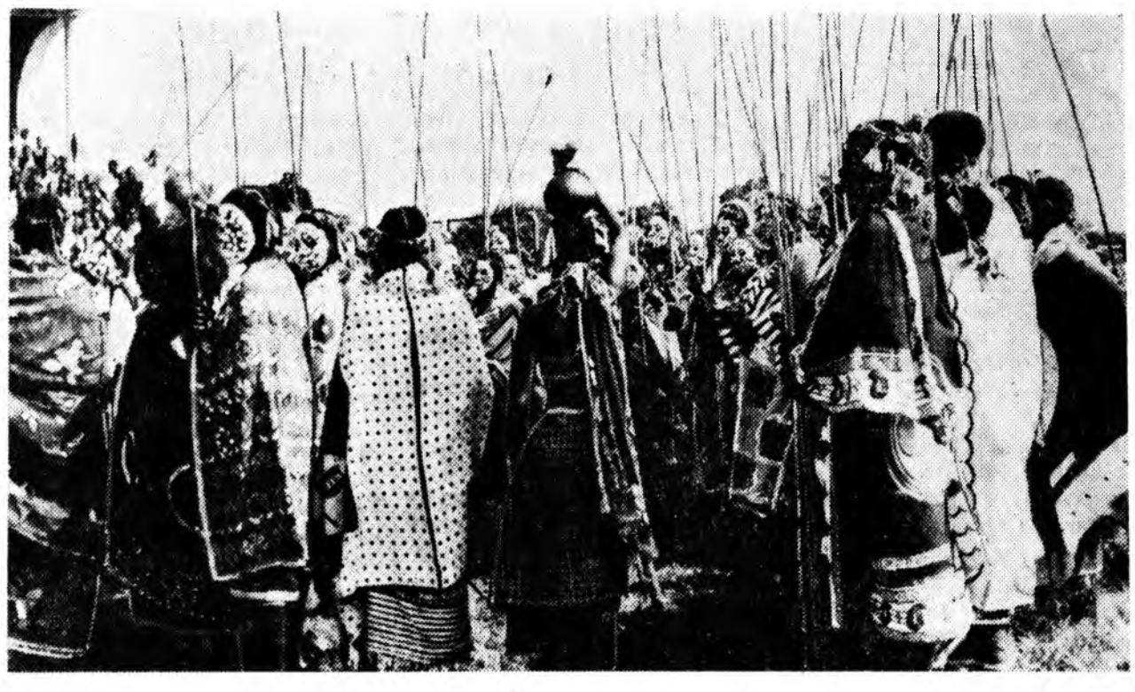
Руанда болон Бурундиин арадууд колониалторта эсэргүүсэн олон жэлэй турша соо тэмсэл хээ. Дэлхэйн нэгдэхэй дайнай урда тээ Германи, 1919 онойһо хойшо Бельги эдэ ороноудые өөһдэнгөө колон болгоһон байгаа. Бельгин харгалзлые болуулаха тухай арадуудай эрлэтые Советскэ Союз, бусад социалис ороноуд, Африка, Азиин хэдэн гүрэнүүд ООН-до дэмжэһэн байха юм. Мүнөө Руанда ба Бурунди бээ даанхай гүрэнүүд боложо байнхай. Бурундиин даанхай байдалтай болон ушар зөрюулагдаһан хайндэр.

Африкын, мүн һулаар хүлжэнги бусадшые ороноудта СССР-эй экономическа харилсаа байгуудта али