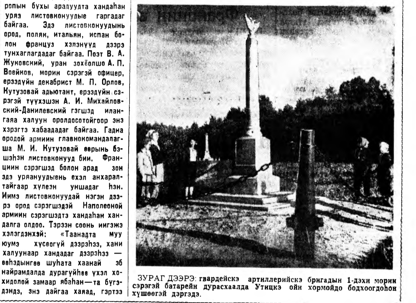
ЗУРАГ ДЭЭРЭ: гвардейскэ артиллерийскэ бригадын 1-дехи морин сэрэгэй батарейн дурасхаалда Утицкэ ойн хормойдо бодоходоһон хүшөөгэй дэргэдэ.

Эсэгэ ороноо хамгаалгын 1812 оной дайнай харгыгаар М. И. Кутузовай гол штаб-байртай хамта займ типографи гэргэдэггүй аблсадаг хэн. Тус типографин ороё бэшэ түхээрлэгэ брэзентээр хушаатай хэдэн өхөнүүд модон тэргэнүүд дээрэ ашагладаг бэлэй. Богонихон амаралтын үедэ, мун хонолгын үедэ хэлбэлэг машинануудынь тэргэ дээрээ буулгагдажа, халуун амал эхилдэг хэн.