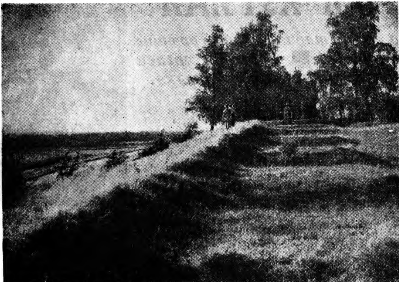
ЗУРАГ ДЭЭРЭ: Багратиново флеш гэж алдаршан бэхилэлын зүүн заха харуулагдана. Тус бэхилэлтэ Бородингой хажууда оршодог Семеновское гэж тосгонхоо баруун урдхана байдаг юм.