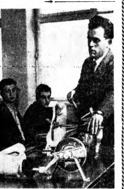
орон дотор байгуулагданхай. Зураг дээрэ: Млада-Болеслав городской техникумэй һурагшад дүүргэлгын экзаменуудта бэлдэхэ байна.

МАЯ ТОО ТОЛГОЙ ОЛОШОРНО ХУДАРЕТ. Румынин «малшад» үшнэ хахад жэлэй туршда шалта туйлаа. Тэдэнэр 560 хүн үлгээртэ үнэж, гахай, хонь, шалхан тэргалуулан байн. Мунөө үедэ эбэртэ бодо мунөө тоо 1 миллион 150 мянган хүн хүртээр ургаа. Энэнь 1951 оной февраль һартай сартада 92100 толгойгоор болго.