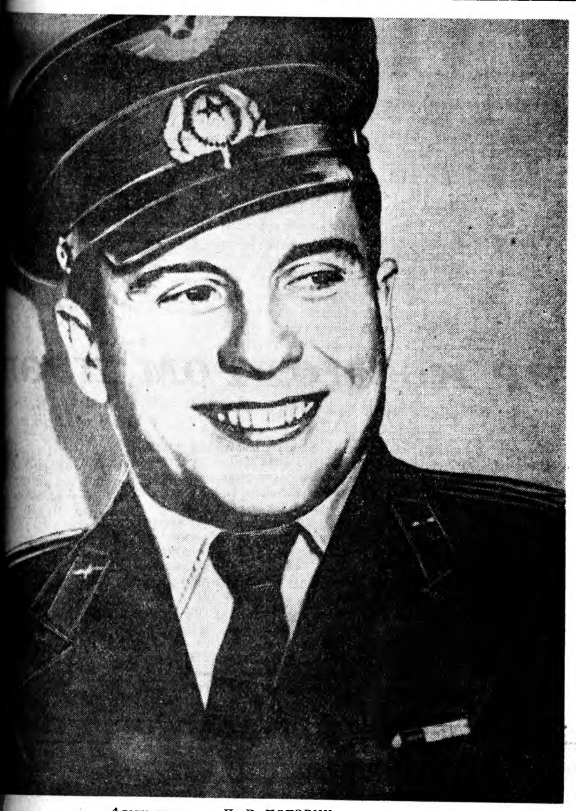
4-дэхи космонавт П. Р. ПОПОВИЧ.