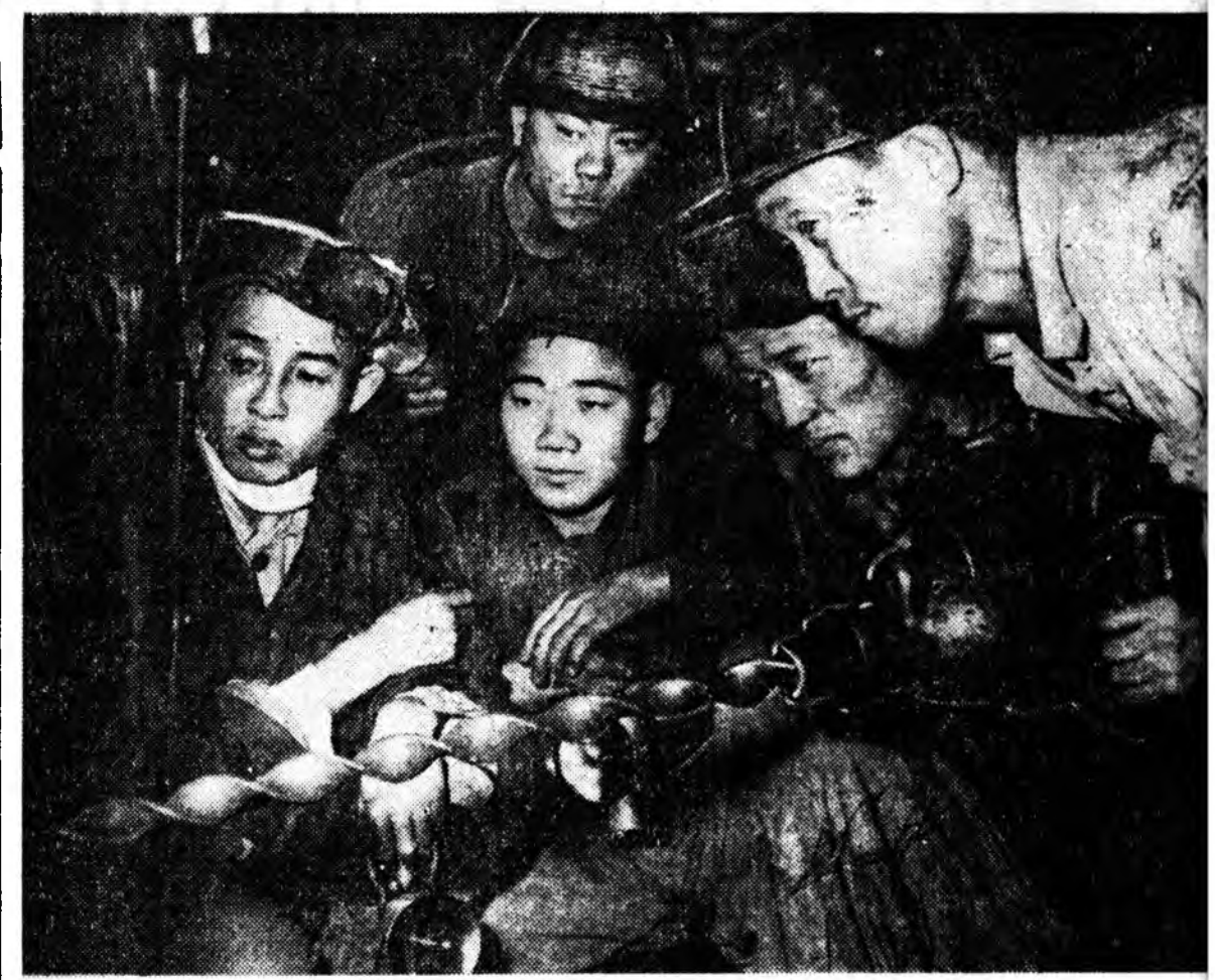
Японой эзэмдэгшэднэ Корейн сүлөөлгэдээр 1962 оной августын 15-да 17 ж Корейн Арадай Демократическа Республикын Аньжун гэжэ уурхайн горнягууд мүн миллион тоноо нүүрһэ малтан абаха зорилго табиһай. 8-дахэ шахтын шахтернууд таха нормоёо үдэр бүрн 120 процент дүүргээ. Зураг дээрэ: 8-дахэ шахтын түүрүү худ өөрынгөө дүй дүршэлдэ залуушууды хургажа байна.