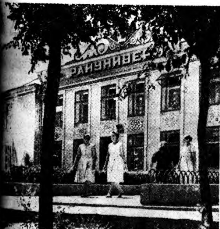
ШЕВЦОВСКА ОБЛАСТЬ. М.И. Мерке тосхондо-мэриальна магазин об-ноого хүдөөгэй эгзэн үшөөрмэгуудай нэгэ гэжэ тоологдодог. Зураг дээрэ: Мерке тосхондохин ун-вермаг.