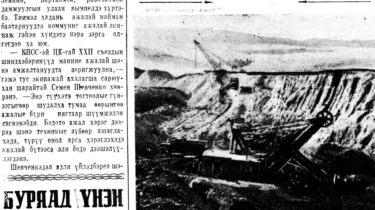
ЗУРАГ ДЭЭРЭ: нүүршэ нэмэл аргаар малталга харуулагдаһан

баригдаа, шахтёрнуудай 90 бүлэ шэнэ гартэ тубхонхон. Ажалладай культурина эрильте дүүргэнэр хангахын тула үнгэрэгшэ жэлдэ, мүн энэ жэлэй 7 нара соо шэнэ гастронорм, мяха болон һү наймаалха магазинууд, прачечна, пионернуудай амраха лагерь, үхбүүдтэй ясти, ула бүлэхэ станица баригдаа. КПСС-эй ХХII съездын түхэхтэ үдэрнүүдтэ шахтёрнуудай горлодо облолой фабрика бүтээгдэжэ ашагалагдаа тушаагдаһан юм. Мүнөө энэ 960 үхбүүдтэй багтаамжатай гурбан дахуур хургуули баригдажа байна. Эндэхид горлодо болбосон түхэлтэй, гоё хайхан болгохо талаар ехэ худалмэри хээ, хэжэше байһаар. Тэдэнэй хүсөөр 16 га талмайтай сээрлиг байгуулагдаһанхай. Үнгэрһэн 24 жэлэй туршада Галуута Нуурай нүүршэдэй 12 миллион шахуу тонно нүүршэ малтажа, түрэл орондоо тушаагаа. 1938 ондо жэл соо оройдоо 3171 тонно нүүршэн абтаһан байһал, үнгэрэгшэ жэл нэгэ миллион 500 мянга гаран тонно малтагдаа. Хамтын хүснэй хаба, совет шахтёрнуудай хүснэ—энэ-бэш аал. ...Удсын боро хараанаар Гусинооэерск хото зайн талаар яларна. Соёл гэгээрэлэй оройной урда талын бүтүү ногоон сээрлиг соо хатар наадан дэлгэрэнхэй, сэлэхэл татама ирагуу хайхан хүйжээ, дунай аялга элдэлнэ. Хайндэрэйхээр хубсалһан хүн зон хүлгөөтэй, тэдэнэй олон нирдоо хэдэн дээрэ зугаалха, хөөрөлдөхөн ахлан. Галуута Нуурай арьшадар тубхнэһэн залуухан горото зугаатай, гоёшы. Түргөөр хүйжээ байһан энэ горлодо эхтэ—шахтёрнууд, барилгашад, алба хаагшад ажабайдал, ажал хэрэгүүд удха түгэдээр, бүришөө гоё хайхан даа. Р. Балабанов