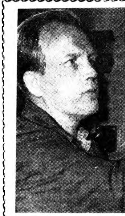
БУРЯД ҮНЭН 2-дохи нюур 1962 оной августын 16.

Республикынгаа ажалшад- та найн шанартай, гоё наан- хан мебель (стол, стол, шифоньер, бусад хэрэгсэл) элбэг- гээр гаргадаг болохо гэһэн фабрикынмай худалдааринашад- дэй гол зорилго болно. Тингээ хүдэлмэршыншад үйл- лэдбэриһнөө арга боломжо- нуудые зүбөөр хэрэглэжэ, ажалтай бүтээжэ дэшижүүл- хэ ба продукциягаа өөрын үнэе хамдаруулха талаар ба- га бэшэ оролдожо гаргаа гэһэн.