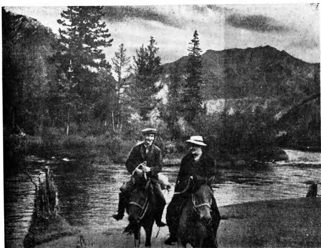
АХА НЮТАГАЙ УУЛААР...