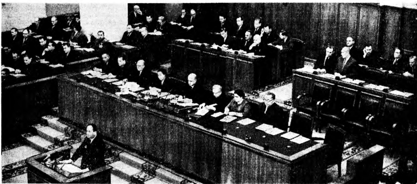
Декабрийн 10-да Кремль соо СССР-эй зургаадахай зарлалай Верховно Советэй хоёрдохой сесси нээгдээ. Зураг дээрэ: Национальнуудай Советэй ба Союзай Советэй хамтын заседанин Президиумдэ, Трибуна дээрэ— СССР-эй Министруудэй Советэй Түрүүлэгшын орлогто, СССР-эй Арадай Ажахын Советэй Түрүүлэгшэ В. Э. Дымшид.

даадын политикые депутадууд нэгэн дуугаар найшааба. Сесси дээрэ Югославин Федеративна Арадай Республикын президент, Югославин Коммунистнуудай союзай генеральна секретарь Иосип Броз Тито үгэ хэлэбэ. СССР-эй Верховно Советэй Президиумэй секретарь М. П. Георгадзе СССР-эй Верховно Советэй Президиумэй Указуудые баталха тухай элидхэл хэлэбэ. СССР-эй Верховно Советэй Президиумэй Указуудые сесси нэгэн дуугаар баталба. СССР-эй зургаадахай зарла-лай Верховно Советэй хоёрдо-хой сесси энээгээр хүдэлмэрээ дүүргэбэ.