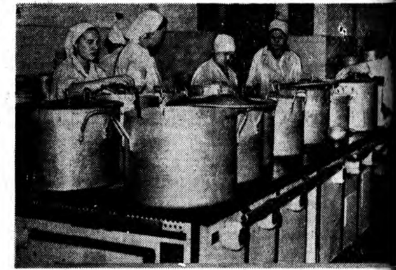
Зураг дээрэ: Электроплитайгай юрэнхы түхэл.