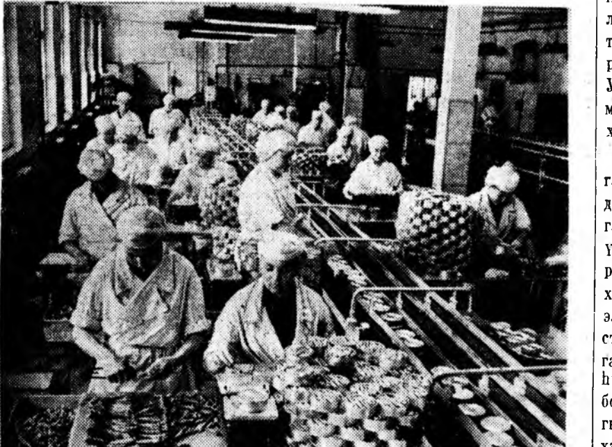
Латвийн ССР. Скултска заһаа-консервын завод жэлэйгээ түсбөе болзорхоон урид дүүргэб. Энэ коллектив 4 мянган цент-нер продукци даабарилгаа гадуур гаргаха гэжэ шийдэб. Зураг дээ-р: коммунис ажалай цехэй нэрэ зэргын түлөө тэмсэжэ байһан тү-рүү цехэй коллектив.

Сахалинай областини хүдөө ажахын хүдэлмэрилгэдэ болон бүхы ажалшад энэ туйлаһан ам-жалтаяа бэхжүүлэн, областини-гоо хүн зоние хүдөө ажахын про-дукцинуудаар гүйсэд хангаха зо-рилые шийдхэн. КПСС-эй ХХII съездын шийдхэбэринуудые бө-дүүлхэ хэрэгтэ өһөдэһингөө ёһо-той хуби нэмэриэ оруулха бээ гэжэ КПСС-эй Центральна Коми-тет, СССР-эй Министруудай Со-вет лаб найдана.