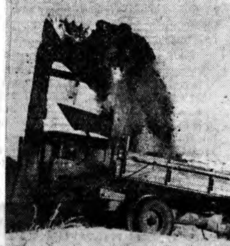
гээр наг шэбхэ шэ-рэнэ. Энэнь ямар аша үрэ үгэнбэ гэхэдэ, бии байһан техни-кые хүсэдөөр ашаг-лана, ажалыньше

хэдэн үшөө юугээ хээр һайса үтэг-рээ һайн бэ гэхэдэ, жэлдэ баян ургаса гэгжэ эндэхи кукуру-зашад һайса ойлон-хой. Жэшээлхэдэ, 3 «Беларусь», 1 «ДТ-54» трактор за-һабарилгада байна. Тракторай заһаба-рилгаһаа ерэмсээр ээлжээтэ трактор-нууд заһабарилга-хаяа ошоно. Кукуруза ш а д а й оньхожоруулагдаһан колонно түрүүн Ша-ралдайда байрлаһан малай фермнүүдэй дазаһаа наг шэбхэ зөөжэ дүүргээд, Хү-сөөтэ нотаг гараха юм. Газарые наг шэб-