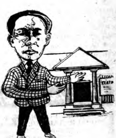
А. ГАЛИСНОВТА Арадай театрай хилэн хүшэгэ Аалихан ирагдабал хольдн Юрөөдэ... Александр, шамда амжалта хүсэжэ, Арадай артист болохыеш юрөөдэ