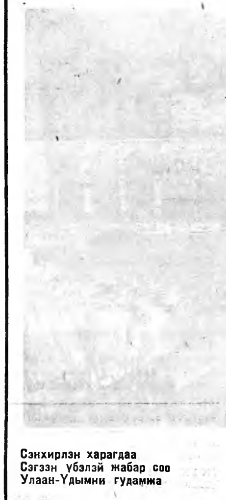
Санхирлын харагдаа. Сагазнь үбэлэй набар соо Улаан-Удымни гудамжа

АДРЕС РЕДАКЦИИ: г. Улаан-Удэ, ул. ФОНЫ РЕДАКЦИИ: редактора — 46-32, зам. отвст. секретаря — 27-37, отделов; партийной — 24-74, сельского хозяйства и советского строительства; транспорта, информаций, литературы и искусства — 34-05, внос и редакция переводов и корректуры — 35-65, для международных переговоров — 16. Ш. Гор. Улаан-Удэ, типография Минис Бюро, Бюро АССР