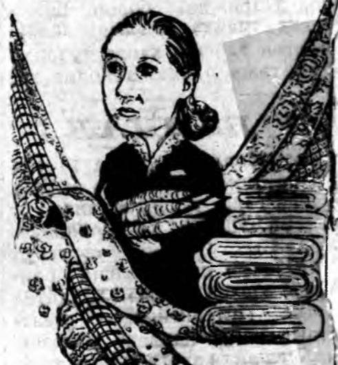
М. АФАНАСЬЕВАДА Эрэнэ сэгэртэ талөдал Энэ сэмбөө дэлгээшэ Эрхим манай Маланья Энэ байна гэшөл.