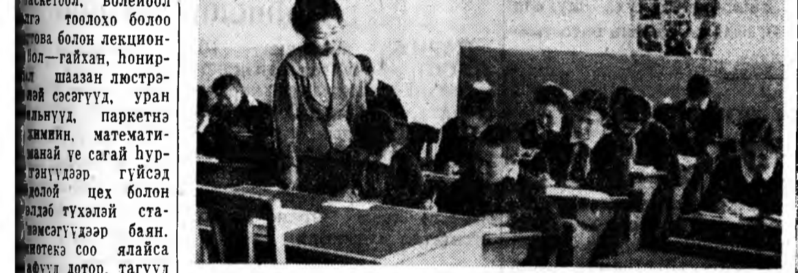
Мухар-Шабарай «Знамя Ленина» колхоз өөрингөө хүсөөр хургуулин 4 шөнэ байшанууды бариа. Мүнөө эндэ Галтай нотагта 11 жэлэй интернат хургуули баригдажа байна. Зураг дээр: Хушуун узууртэй 8 жэлэй хургуулин 5-дахи колхоз хэшээл үнэргэгдэжэ байна.