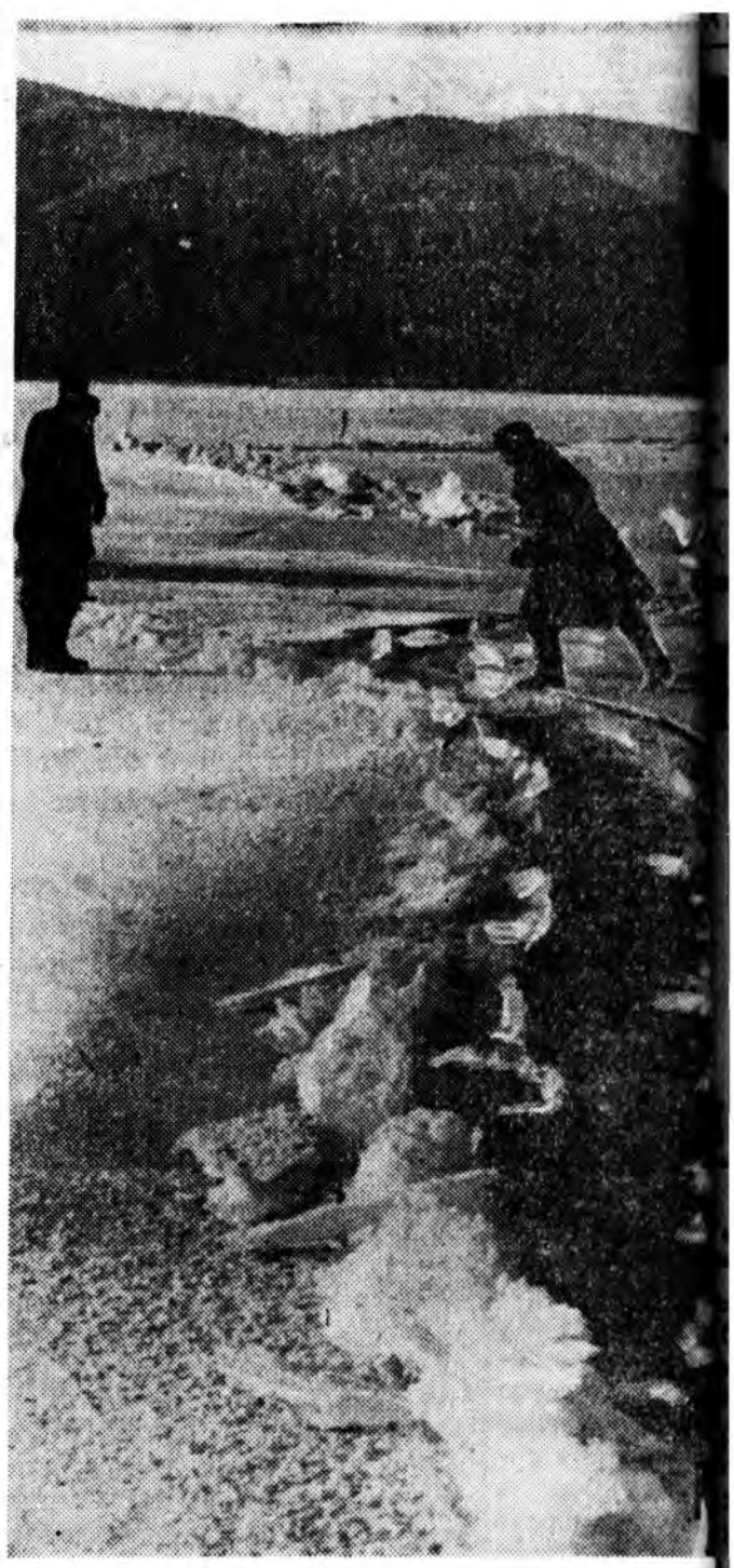
Январь нарада Байгал дээрэ...

Хүндэтэ уншагшад! Январин 20-ной үдэрэй 10 часһаа дурсагдаһан магазинуудта эржэн, тание хонирхожо асуудалнуудта харюу абахаданай болохо. Буряадай эрдэм-шэнжэлэлгын комплексно институтай эрдэмтэдэй эржэ уулзахыетнай уриалнабди.