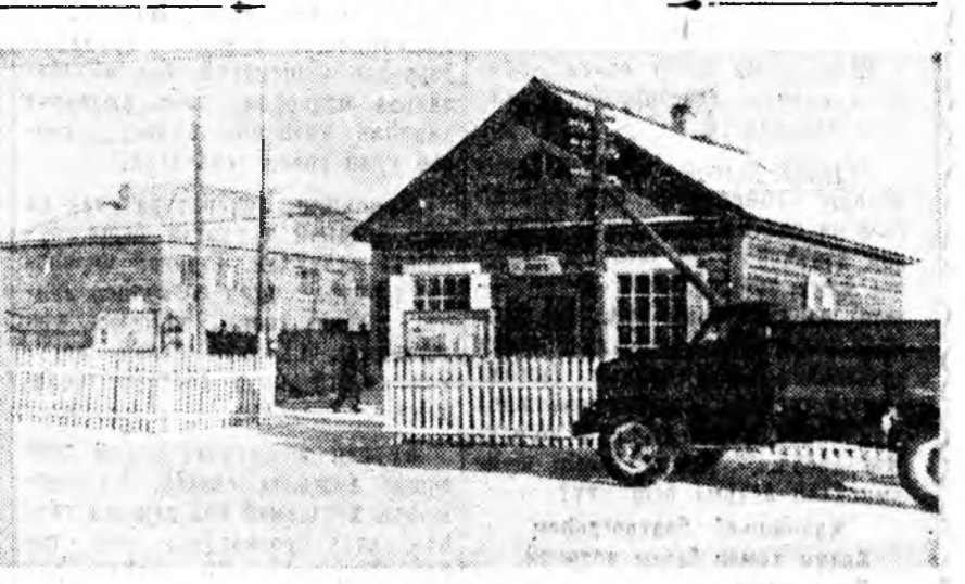
ЗУРАГ ДЭЭРЭ: Коммунист ажалай коллективэй худэлдэг номой магазин. Саада таладаньшлакоблоогоор баригданан 8 квартиратай байрын гэр.

Н ЛУБАЙ урда бага түхэрэлтэн сахаригданан эрьетай, хэндэшы хэрэггүй гэжэ тоологдог Удөөн захэ абаһан хоохон байдаг набтар газар бии агша һан гүб даа. Хамтадаа 4 гектар талмайтай энэ газар тойруулан хашалагдажа, ургамалнуудар байн эсэрлгн байһан амаралтын орон болгогдохоор хуури табилгаа. Тэндэ 8500 ургамалнууд хуулибарилгаа. Тэднэй дунда акаци, клен, крыжовник, улаангир болон бусад түрлэй модонуд тарилганхай. Удөөн бурдүүлжэ, наһша намаагаа дэлгэжэ захалганхай. Тингээд саашадаа мүнөө хабарһаа амхилжэ, парк дотор бусад хэргэһэнүүд болон түхөөрөлгөнүүд бии болгогдохоор хараалагдана. Зүгөөр эндэхи