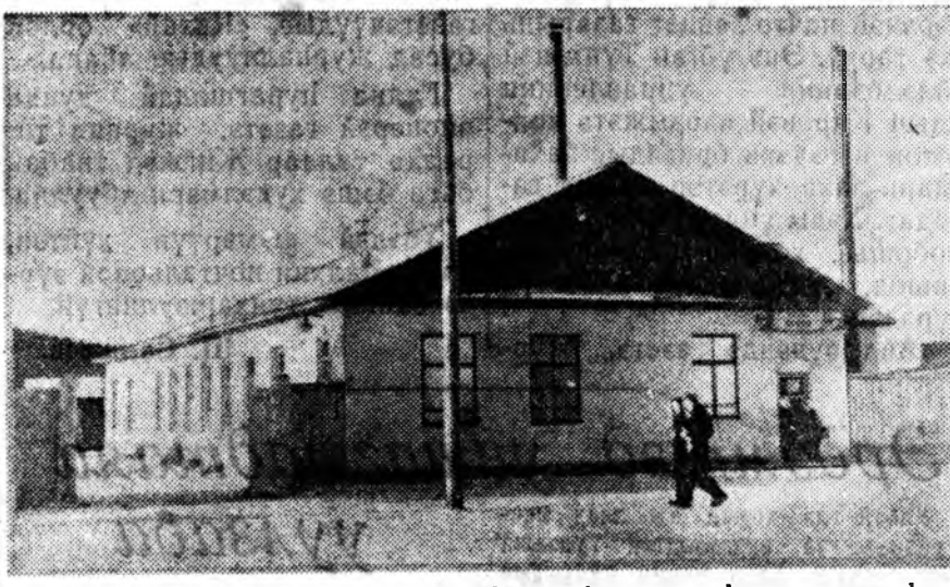
ЗУРАГ ДЭЭРЭ: шулуугар баригданан оньһожоруулагданан хилээмэнэй пекарин.

1959 оной барилганууд боддогдож захалаа. 1959 оной асаста хуушан Хорин зүүн хахадтай колхозууд нэгдэж, гурнай ажамжи болоо бэлэй. Хорин зүүн үзүүртэ оршон ахан РТС-эй хуури дээрэ амхидхадан Анагай сохозой түб хуури түбхүнэж, тэндэхи оршон тойроние эрид хубилгаа захалаа. Энэ дундай нөдөнд зун амхидхадан Анагай сохозой гол захиргаанниин баһа тогтохой. 1962 оной апрель. Худөө ажамжи улам саашадан хүжөөж, тэрэнэй хуулибарилгы амхитэйгээр шондхэн хубилгаа тухай асуудал зүбхэн хуулибарилга КИСС-эй ЦК-гай мартын Пленумэй тогтоодой үндэһээр колхоз, совхозуудай нутагай үйлдэбэриниин управлениинд байгуулагдажа амхилһын мэдээж. Тимэ нэгэ управлени Хорин, Ярууны аймагууд хаа бүрлэжэ, захиргаанниин түб Хори дээрэ мун лэ хуурижаба. Удаань КИСС-эй ЦК-гай ноябрийн Пленумэй тогтоодой үндэһээр Хорин, Ярууны аймагууд нэгдэжэ, аяар 127.6 мянган дүрбэлжэн километр газары эзэлһэн республика дотороо эгээл томо нэгэ аймаг болгогдон байна. Тигээжэ тэндэ худөө ажамжи эрхилдэ ажамжиууд Хорин үйлдэбэриниин управленид мэдэлтэй зангаараал үлэдһэн. Аймагай оршондохи арадай газарлал, соёл, культурын, амналтын, коммунальна, худалда наймаанай болон бусад олон амхи зургаануудай хуулибарилгы захиргаанууд, ажамжиууд депутадуудай аймагай Советэй гүйсэдхэхэ комитет Хори тосхондо хуурижаба.