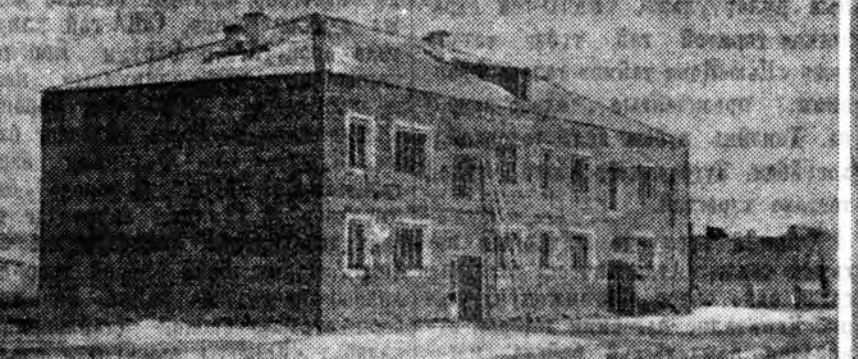
ЗУРАГ ДЭЭРЭ: 2-дохой СМУ-гай барилга байһан байрын гэр.