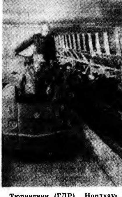
Тюрингин (ГДР) Нордхау- зен-Дарадах арадай ажакыда барилганан үнөөдэй байра.

Монгол Арадай Республикын ниислэл улам бүри гоё һайхан боложо байдаг. Улаан-Баатарай үйлснүүдтэ шэнэ барилганууд улам бүри олоор бөхөгдөнэ. Хо- тын зүүн-хойто хубида барилдын эхэ талмай бин. Тэндэ хүчэй хүд- элжэ байхын харагдадаггүй ша- хуу. Зүүрөөр принцетэй ашаанай автоматинууд эржээл, томо хүс- этэ крануудай үргүүлдүүдэй эрхэлдэхын харагдажал байдаг. Гэр барилдын комбинадта бүтээг- дэһэн нэгэн янзын деталинуудаа республика дотор анха түрүүнээ эндэ гэрнүүды хабсарган бари- на.