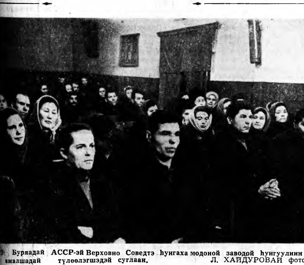
Буряадай АССР-эй Верховно Советэ хунга хаа модоной заводой хунгуулин ажалшадый түлөөлөгшэдэй суглаан.