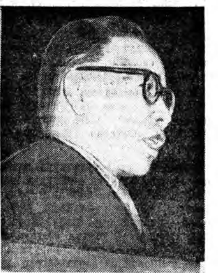
Поэт Ш. НИМБУЕВ.

һэн шүлгүүд өөрынгөө арюун уялые дүүргэнэ байха. Тэрэл шүлгүүдые бэшһэн биднэртэ мүнөө суулетэ сагта дуулаагүйдэ аргагүйл, дуулахадаа, үе сагайнгаа хүнэй үер бодол руу шунгаагүйдэ аргагүйл! Мүнөө хүгшэрһэн хойноо гүн бодолой нарин утаһые харуулха гэжэ хүсөөшэмнай буруушые бэшэл даа, инга дуран тухай бэшэхэ дуран хүрэнэ, юундэб гэхэдэ, залуудаа бэшэхэ сагнай манда байгаагүй юм.