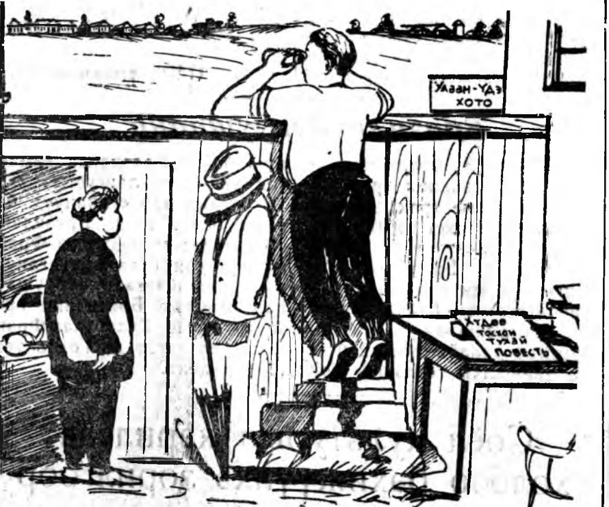
Уран зохиолшоднай ажабайдалтай нягта холбоотой болоогүй байһаар. (Н. Балданогой тоосоото ахидхэлһээ).

Уран зохиолшо: Бидэ танине ураагүй һелди. Хүдэлмэришэд: Урашөгүи һаатнай, өһөхэдэ ерээбди. Хүдэлмэришэд тухай зохиол бэшэнгүит гэнэн гомдоллоо хэлэхэмнай, оруулагты.