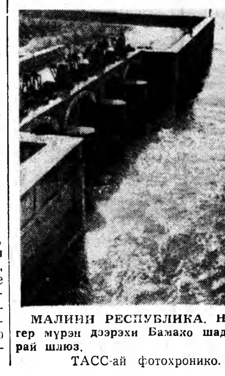
МАЛИН РЕСПУБЛИКА. Нигер мурэн дээрхи Бамажо шадарай шлюз. ТАСС-ай фотохронико.

КАИР, февраллин 23. (ТАСС). Ирагай премьер-министрэй орголшо, додотодын хэрэгүүдэй министр Али Салех Саиди түрүгтэй Ирагай тусхай делегациин гэшүүдтэй ОАР-ай президент Насер үсэгэлдэр эндэ уулзаа. Энэнтэй дашарамдуулан, «Аль-Ахрам» газета, тусхайлбал, ингэжэ бөшөнэ. Арабуудай хоорондын асуудалнууд, Араб Зүүн зүгтэхи байдал, тэрэшялын хоёр орондо хамаатай элдэб асуудалнууд 6 шахуу часай турша соо ургалжалһан аде хэлсээнүүдэй үгэ зүбшэн хэлсэгдээ.