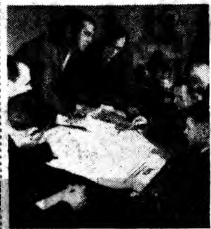
КРАСНОДАРАЙ ХИЗАР. Усть-Лабинска хүдөө амакхын үйлдэбрийн управленин амалда таргалангайгаа талмай хубаарилгы хубилгангай ба ороһоото ургамалуудай ургасые дэзшүүлгэний ашаар гектар бүрийн дунда зыргын ургасые 200 пүүгэтэ хүргөөд, жэл соо нэгэ хэзэ дахин шахуу эхэ ороһоо абадаг болохо гэжэ шийдэһэн байна.

1963 ондо управленин колхозууд болоо совхозууд гүрэндэ 13 миллионһоо дэзшэ пүүгэ ороһоо тушаалха юм. Үгэ, мяха абаха талаар түрүүшын элжээний зорилго дүүргэжэ, таргалангай зуун гектар бүридэ 60 центнер махан, 245 центнер һун абаха.