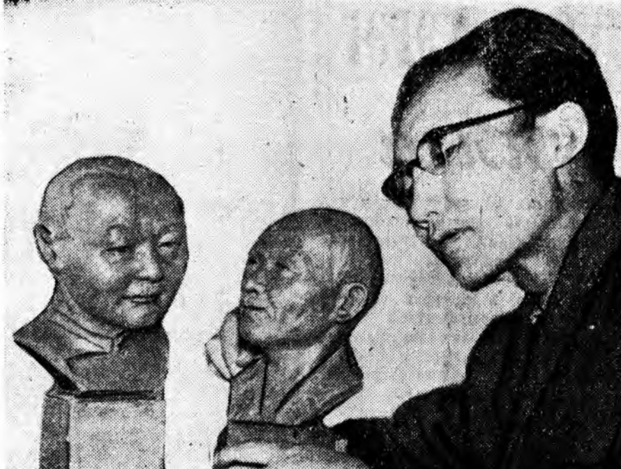
Хүн ямар нэм, тэрэнэй дүрэ хүрэг өөртэйнь адляар бүтээх гэвэл эххэн уралал...