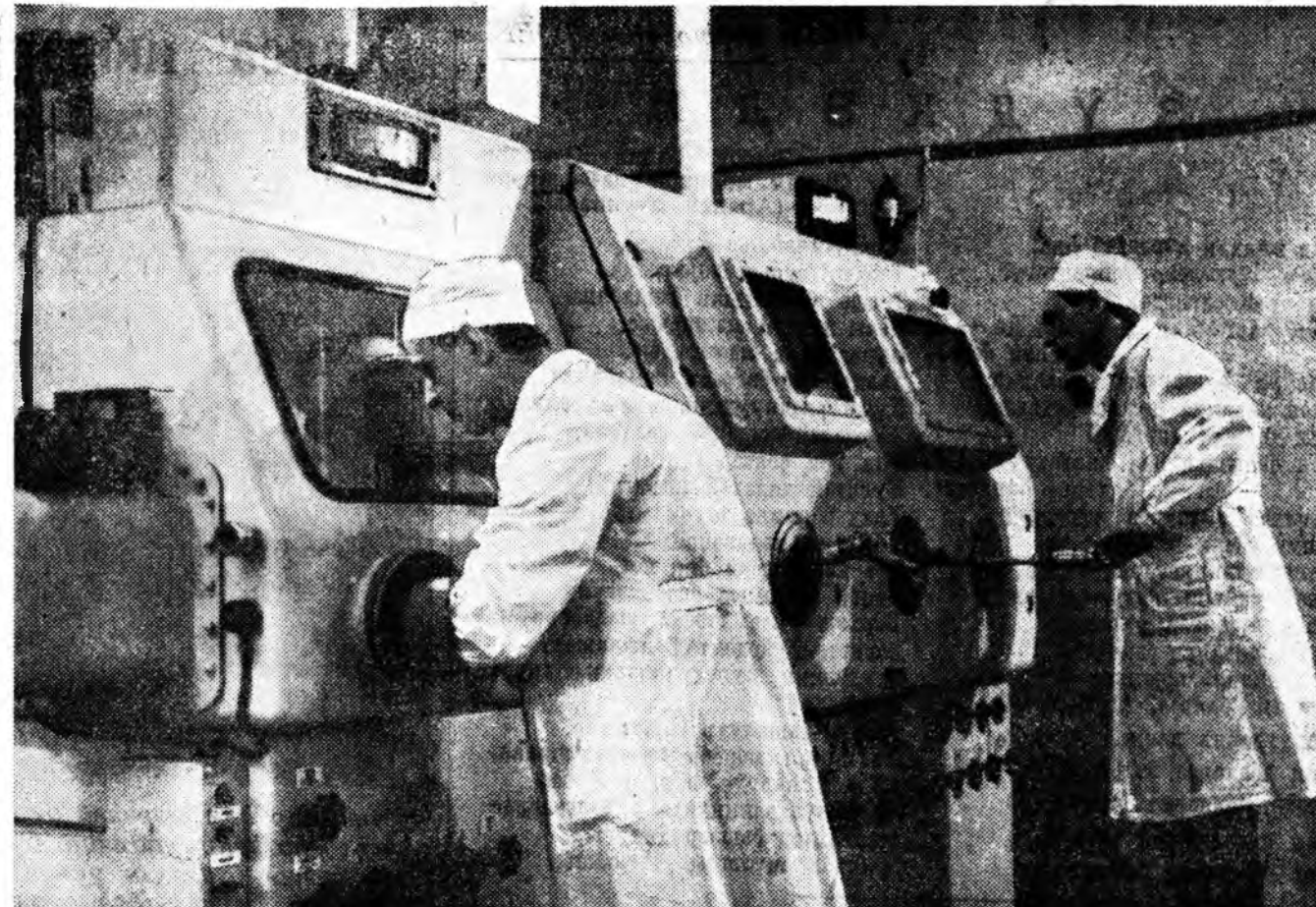
Ядерна элшэ хэрэглэдэг арганууд болон приборнуудай соннархотой предпритинуудай үйлдбэрлэдэ нэбэрүүлхэ зорилготой изотопной лаборатори Красноярска байгуулагдаа.