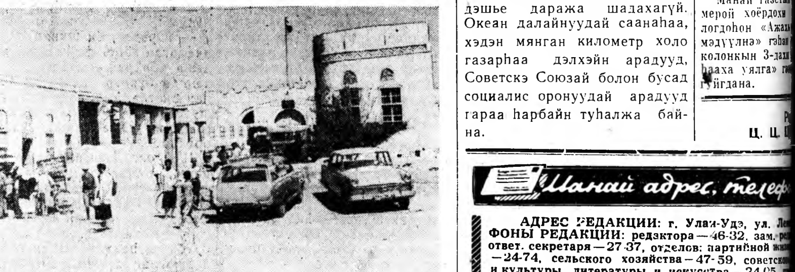
Иемэнэй Арабуудай Республика. Ходейда городтохи больница. Эндэ элдэб мэргэжэлэй арбан совет врачнууд хүдэлнэ.

БАРУУН БЕРЛИН, мартын 21. (ТАСС). Сэрэгэй ёһоор эмирхэгдэлэн Баруун Берлинэй полици буу зэвсэг эхээр бэлдэнэ. Баруун Германиһаа броневиүүд эльгээгдэхэ болобо.