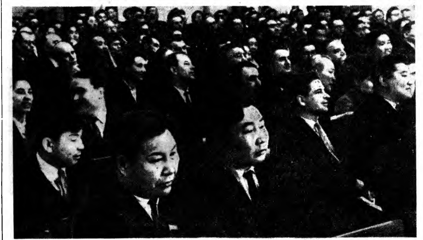
Бурядай АССР-эй зургаадахи зарлалы Верховно Советдэй 1-дэхи сессин заседанин зал соо.

Дурсагданан асуудалаар Бурядай АССР-эй Верховно Совет дэлгэрэнгы тогтоол баталан абаа.