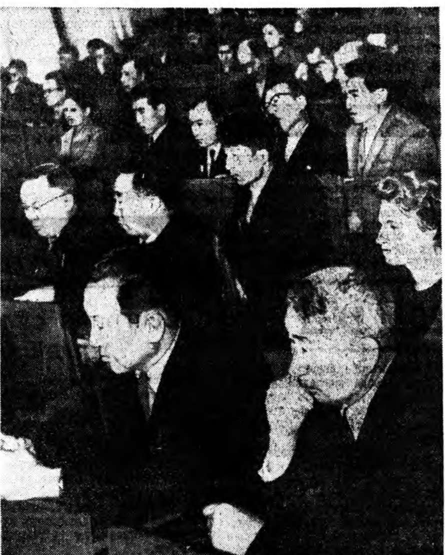
Газарай хурьһэнэй гэмтэхэ ябадалтай тэмсэхэ асуудалаар болоһон научна үйлэдбэрин конференциин зал соо.

Ой модоной ажахынуудай хүдлэмэригшэд ой модо түймэрөө хамгаалха, ой модо зүбөөр ашлагдан хэрэглэхэ гэжэ оролдохо уялгатай болоно.