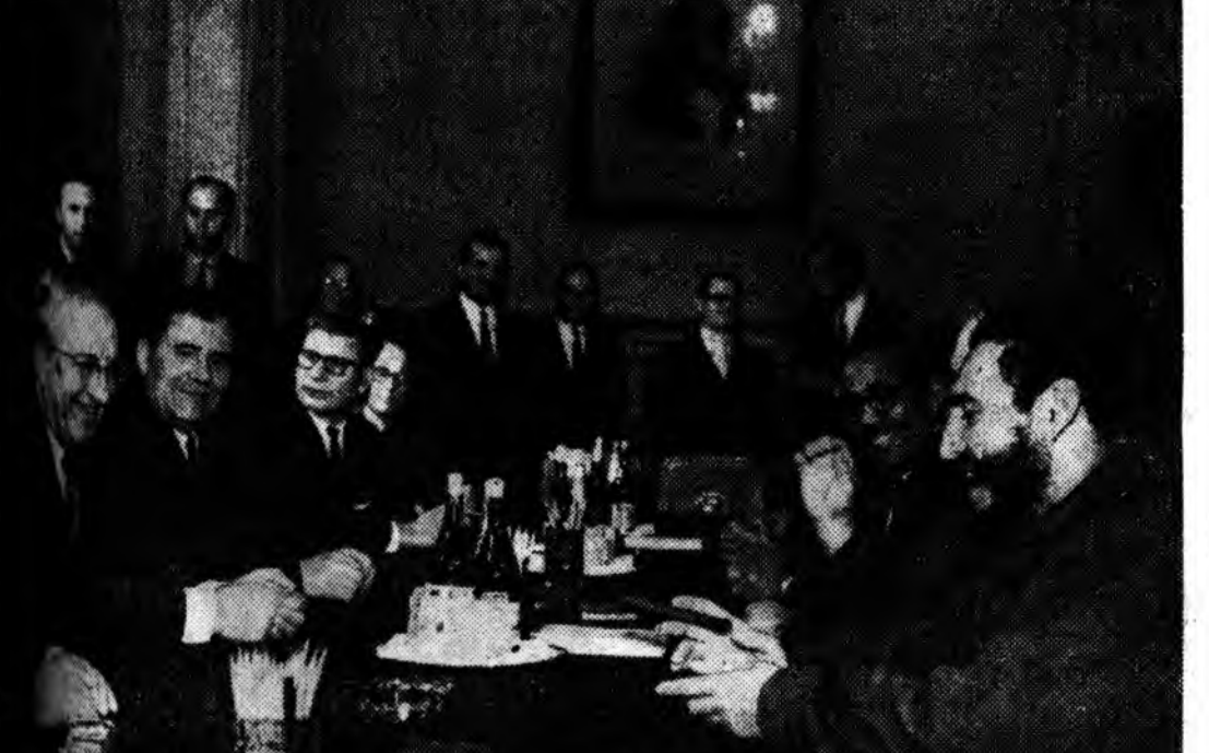
Союзай ЦК-гай Нэгэдэхэ секретарь, СССР-эй Министруудэй Советэй Түрүүлгэжэ революциин нэгэдэмэл партиин национальна хүтэлбэрилгэжэ нэгэдэхэ секретарь Премьер-Министр Фидель Кастро Рус гэгшэстэй апрелин 29-дэ Кремль дунда: үзлэлгын үелэ.