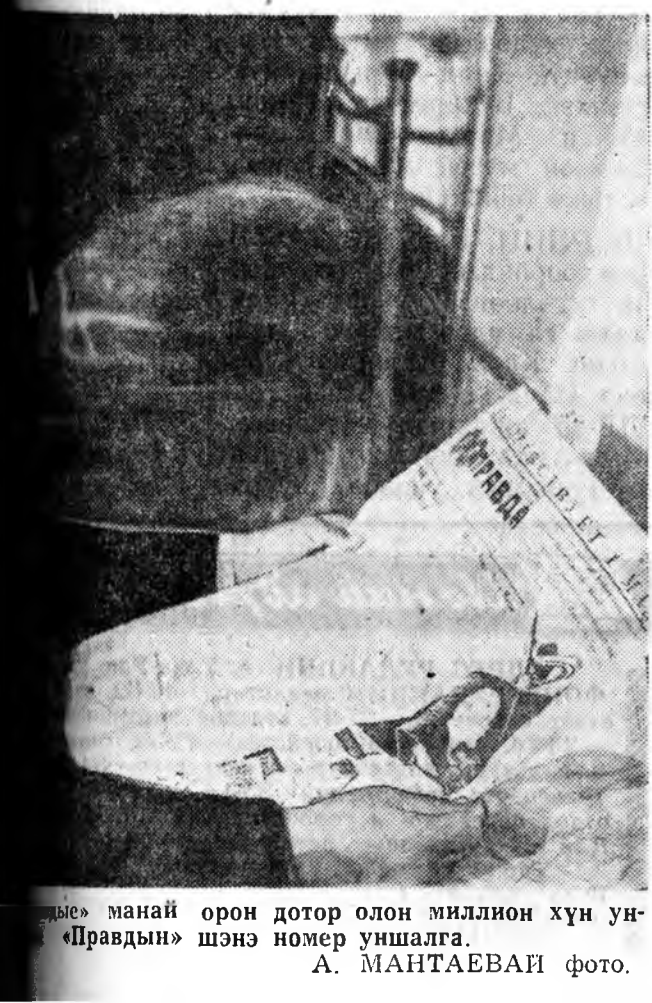
«Правды» манай орон дотор олон миллион хүн уншдаг.