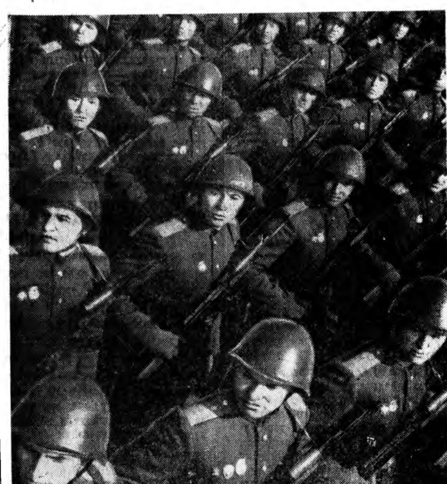
1963 ондо Москвада болоһон Майн Нөгөнэй һайндэрлэгэ. Москвагай гаринзоной сэрэгэй парад. ТАСС-ай фотохронико.

Манай частнуудта парти, правительствын хушгәһиңдэд ходо ерад болон, 1942 оной апрелин 24-дэ СССР-эй Верховно Советей Президиумэй түрүүлэгшэ Михаил Иванович Калинин ерээ һөн. Тэрэһи хэлһэн дүлэтэ халуун үгэ сэрэгшэды зоригжуулжа, халуун шанга тулалдаануудта урылаа бэлдэй. Илалта манай гарта гэжэ сэрэгшэд батаар эгээлдэг байгаа.