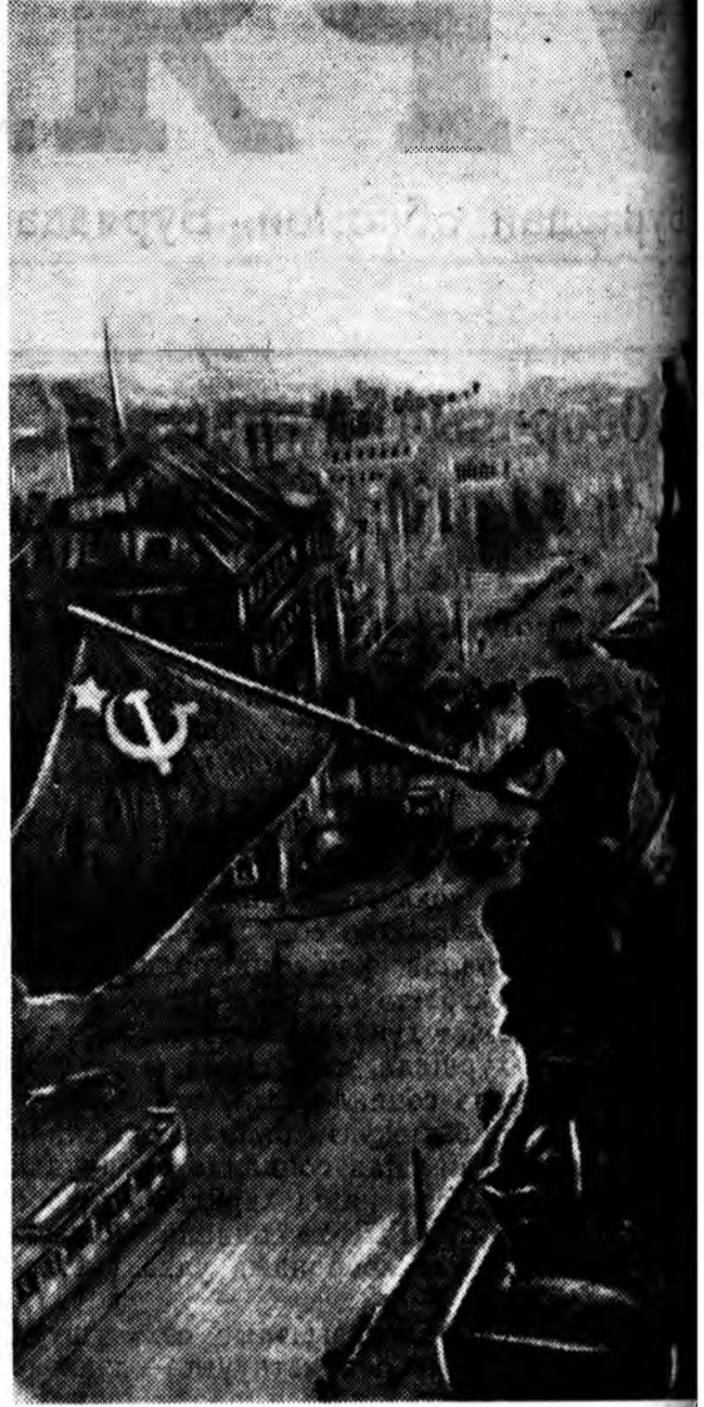
Рейхстаг дээрэ илалтын туг хиндхэжэ байһан ТАСС

зорилготой, сүлөөрэгын дайё хэжэ байба. Советскэ Союз хадаа социализмын туйлаһанууды, бүхы ажалһадай түшгэ тулгуур болохо өөрһингөө социализм Эсэгэ оронине дайсаһаа хамгаалжа, гадна немец арадыг Гитлерэй алуурһадай засаг түрөө мусталан гаргаха хэрэгтэ туһалха зорилго таһиһан байна бшуу. Европине тахал үшүнөөһө зайсуулжа, хэтын хэтэдэ Европодо нэгэ найрамдал батаһан тогтохо өлгө зорилготойгоор бидэнэр Германи ерһэн байһабди.