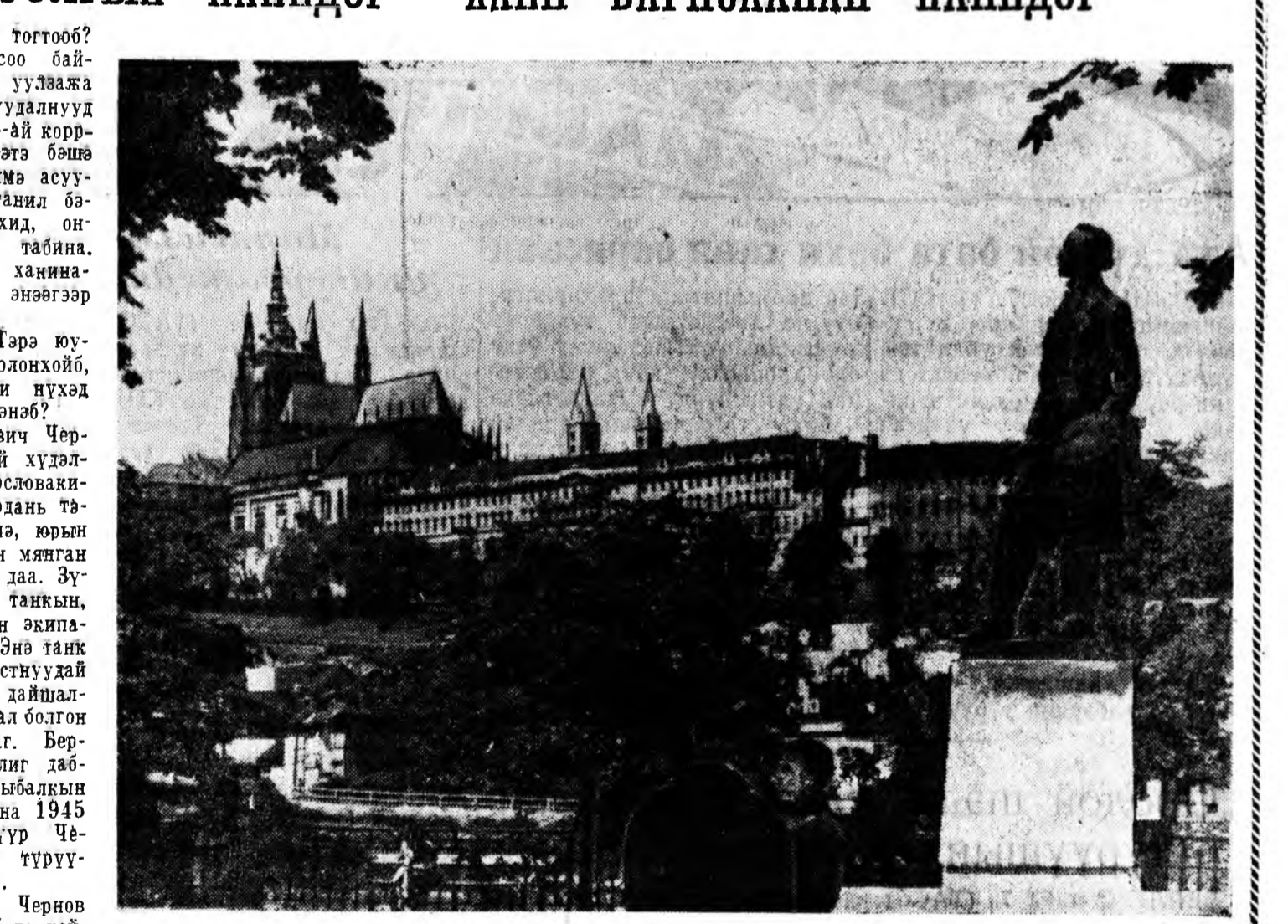
Чехословакиин социалист Республика. Прагын Кремлин (Град) тухал маг. Эиз 1000 гаран жэлэй саада тээ байгуулагдан юм. Наада таладаны Чехословакиин мэдээжэ уран зурааша Иозеф Манесай (1820—1871 онууд) памятник.

«Нүхэр Чернов хаана тогтооб? Прагада хэр удаан саг соо бай-хаб? Тэрэнтэй хэзээ уулзажа болохо? — гэһэн асуудалууд һүүлэй үдэрнуудта ТАСС-ай корр-пунктаа телефоноор нарэгтэ бишэ табигдадаг болохой. Иимэ асуу-далнуудые танилше, танил ба-шашье хүнүүд, прагынхид, он-до тээһе ерэгшэдыше, табина. Зүгөөр Чехословакида ханина-рын—журналистууд энээгээр илангага доирхоно.