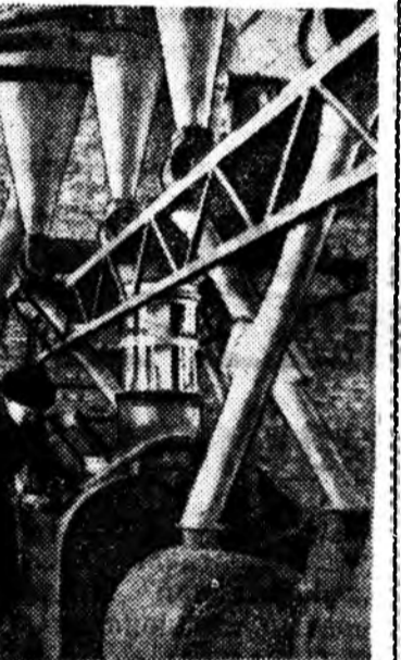
КУРГАНСКА ОБЛАСТЬ. Курганска уйлдэборини... Курганска уйлдэборини...