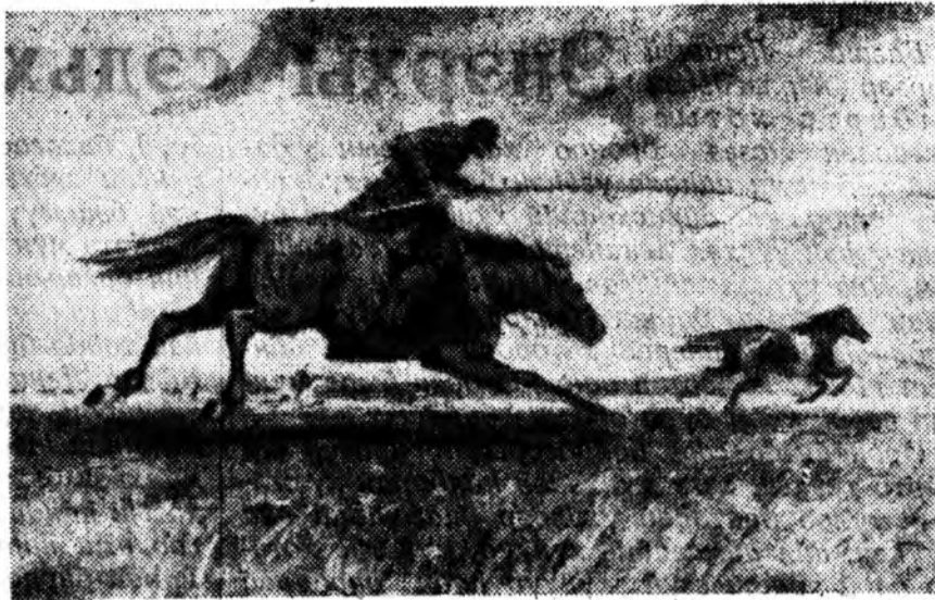
«УРГАШАН». (Картинааа буулгабари).