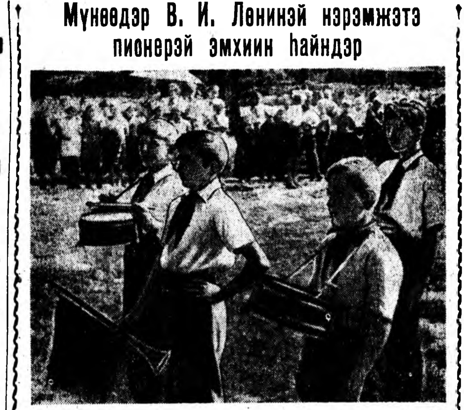
Мүнөөдэр В. И. Ленинэй нэрэмжэтэ пионерэй эмхин һайндэр пьесууд баруулагдаа. Улаань һуругууд бүхэндэ концертүүд боллоо. Пионерүүдэй байшанда 1-4 классай һурагшад кулдын театр харуулагдаа.