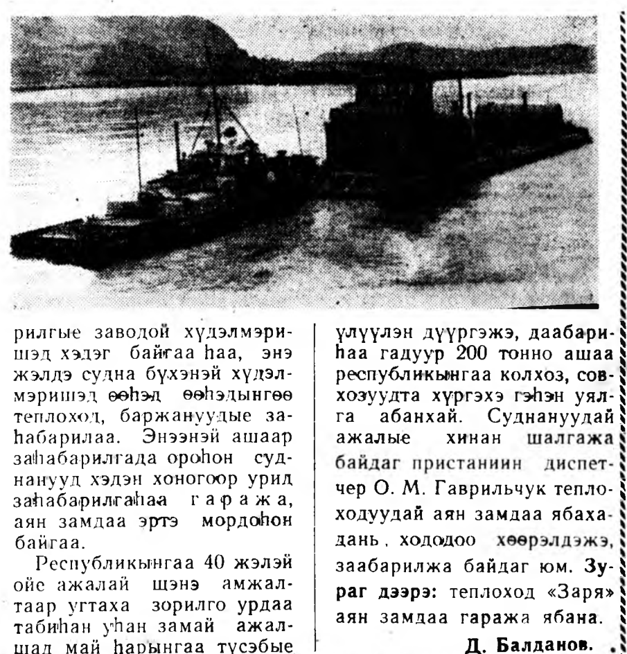
Улаан-Удын пристанини хүдэлмэришэд түүхэтэ долоон жэлэй табатахи хабарые һайн бэлдэхэтэйгээр угта...