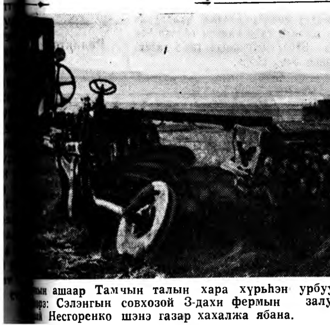
...ашаар Тамчын талын хара хурьһэн урбуу- ...Тоз: Сэлэнгын совхозой 3-дахы фермын залуу ...Несогоренко шэнэ газар хахалжа ябана.

А. ЯКОВЛЕВ, ...түмэр зам заһабарилгашдай бригадир.