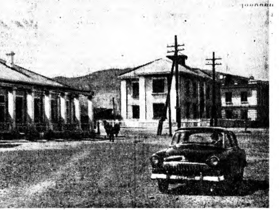
ЗУРАГ ДЭЭРЭ: урдан хоһон тала байһан газарта тогтоһон болбосон түхэлтэй Гусиное Озеро станциин тосхойн нэгэ үйлсэ харуулагдаһа.

предприятини вагондо модо ашаалдаг архагар ута гран холоһоо харагдадаг, саашан шэртэхэдэ модо ойһоо таллуудлагэ автомашинуудайн парк, һаһар ашаглалгада оруулагдажа байгаа модо хөрөөдхэ автоматическа цех болон баше барилгануудын тобындон. Энэ предприяти жэлдэ 100 мянган кубометр хөрөөдэмэл, монсогор модо Казахстанай Целинне хизаар элгээдэг. Модо бэлдэхэд ажалда эрхим амжалта туһалаһангайа түлөө һөндөө бүхэсооһона шанда хүртэнэ солотой.