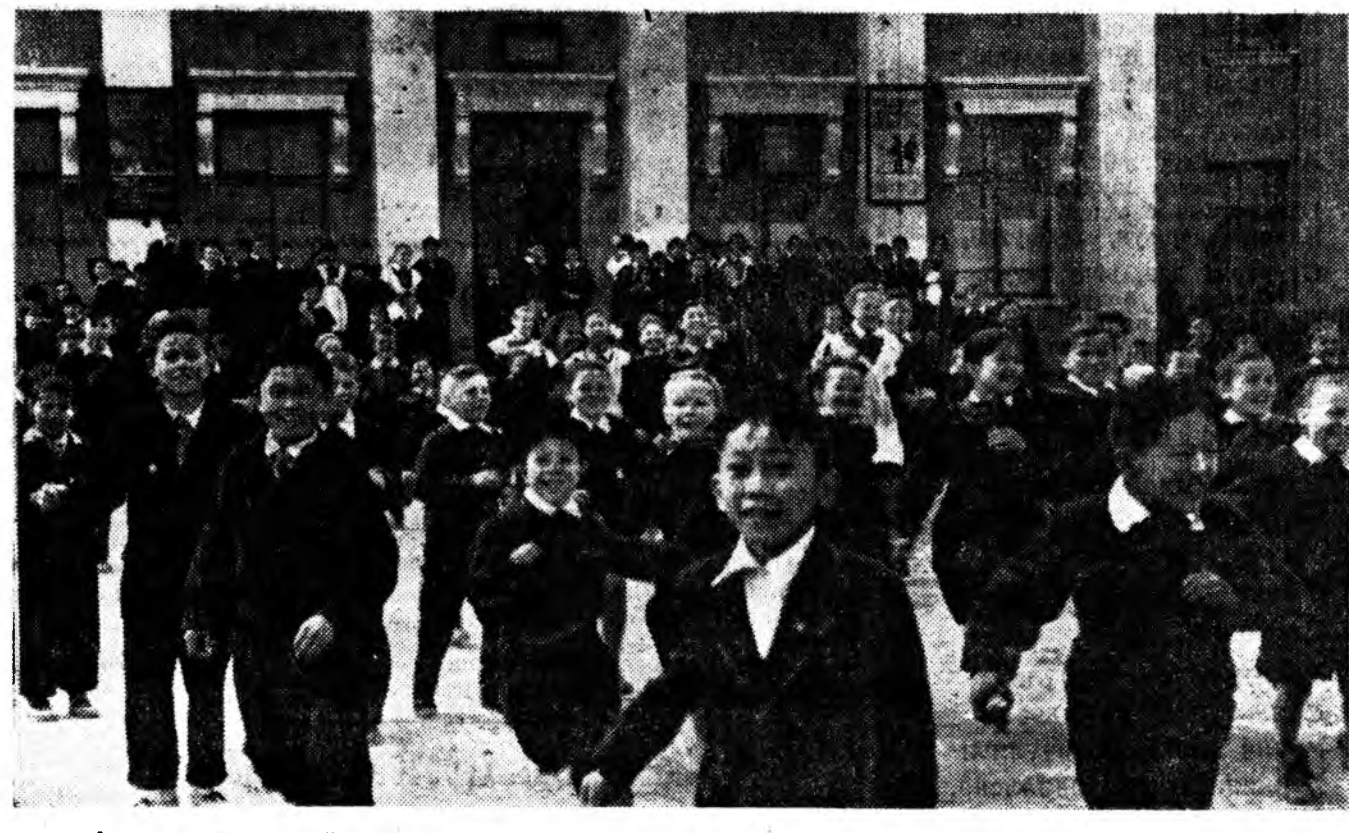
«А» үзэг мэдэхэгүй элинсэг хулинсэг үбгэн аба жыһээ уг залганан хүхкүтэй баяртай нурагшад. Гусиное Озеро түмэр замай станциин № 92 дунда хургуулида 1400 үхнүүд нурагшана.