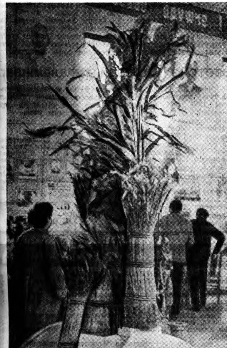
Хүдөө ажыхын павильон.