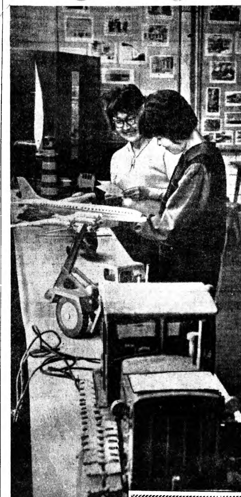
Арадай гэгээрэһе харууһан павильон.

Саашаа энэ туйлаһан амжалтада бүри арьбадхажэ, коммунизм урган далайстайгаар байгуулжа байһан түүхэтэ үдөө бүри эршэ түгсөөр ажаллажа, ерэхэ ойн баяры ушөө эхэ баартайгаар, бүри эхэ амжалтайгаар үнгэрэхэ байһан тухайһаа мүнөө уришалан юрөөл тагилдагтайби.