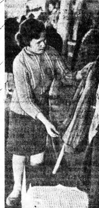
Нютагай промышленностин павильон.

Павильонной газар талданы «Техническое бюро» хүсэдөөрн ашгалай гэнэн үгэнүүдэ улаан бүд дээрэ аржытар бэшэнхай. Төвө шадар 110 моринной хүсэтэй модо шэрээлэг «МАЗ-501» автомобиль, 4500 килограмм ашаа 4 метр хүртээр дэһэн үгдэг «КМЗ-П-1» гэжэ поргузчик, модо таллууд «ТД-40», «ТД-75» гэжэ тракторнууд хүн зоний үзэмжээд тагилдасһай.