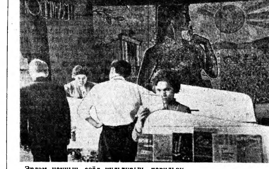
Эрдэм наукин, соёл культурын павильон.

Автотранспортты, убан замшы энэ хугасаа соо үндэһөөрөө хубилаа гэжэ выставкэда тагилдасһан зүйлһүүд тодо һоноргоор гэршэлхэ үгэнэ шуу.