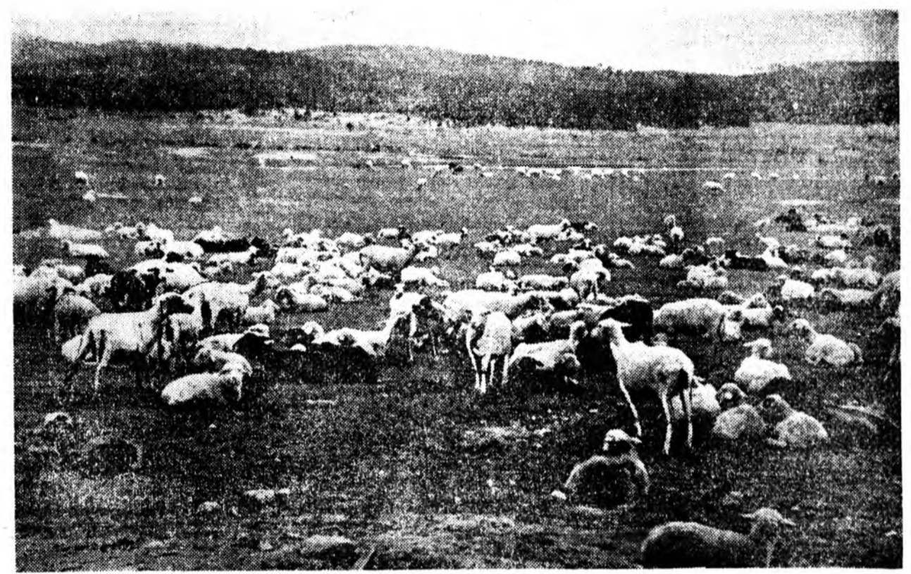
ЗУРАГ ДЭЭРЭ: Сэлгэ Чисанын тунга ногоотой бэлшээрндэ эндэхи совхозой хонид.

Улаа хангагүй ургаса хуряалгад түрүү дэй дунда хуряалга, хурал-дан ургасага гүрэнөөр, голта хо-ростогүйгоор хуряалга, гүрэндэ та-рия худалдаха уялгыг бэлдэһон урид дүргэхэ, үзүүлэн дүргэхэ тунгажэ. Эхэ ороһонгоо амбарга таряа оруулаха, колхозууд болон сов-хозуудыг һайн шанартай урһөөр хангаха гэжэ мүнөө олоо шухад зоригдэ болон байна. Эндэнтэй хам-та намарай тариан, намарай паа-халаһа болон худөө ажакын бу-сад худалмэри шимсэг үүсхэ үүсгэжэ тарианай нитын мал ажаады ур-гэ хэмжээтэй үблэ талсаа бэлдхэ-х шухала.