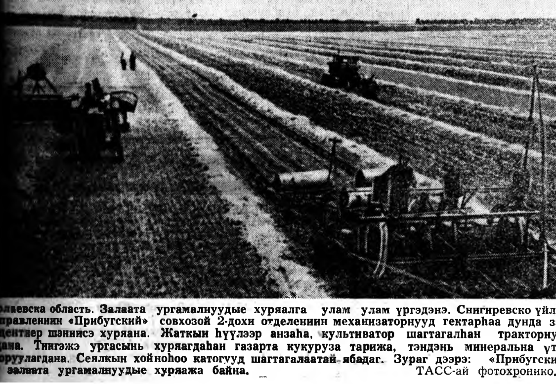
Ургамалуудые хурялга улам улам үргэдэнэ. Сингиреско үйлд-соховозой 2-дохи оздленин механизаторнууд гектарһаа дунда эр-галууды шяныжэ хурялана. Жатын һүүлээр анзаһа, культуватор шагтагалһан тракторнууд дана. Тийгэжэ ургасын хурягадан газарта кукуруза тариха, тэндэнь минерална үтгэр-оруулагдана. Селкын хойноһоо катогүүд шагтагалаат ябадаг. Зураг дээрэ: «Прибугский» алыга ургамалуудые хуряжа байна.