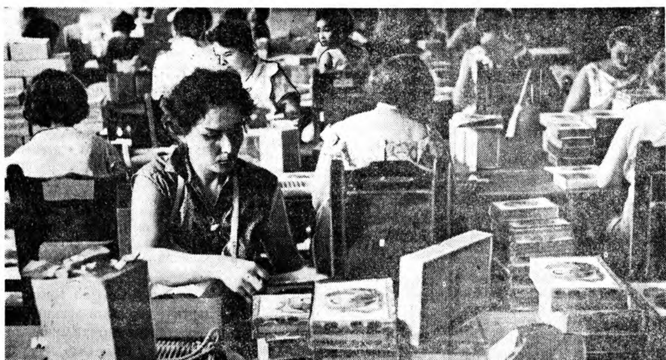
Кубын Республикын тамхнай фабрикануудай гаргадаг сига ранууд бүхы дэлхэй дээрэ суутай юм. Эдэ фабриканууды гүрэнэй мэдэлдэ абанһаа хойшо там хинай предпритиуудтахи ажалан эрхэ байдал найжаржа, ажалай бүтээсэ дээшлээ. Зураг дээрэ: Гаванадах там хинай фабрикын нэгэ цех.

сүлөөрэлгын түлөө тэмсэлэй дү-дые хэншье унтаргажа шадахаяа бодёо. Энэ дүлэн үдэр ерэхэ бү-ри сорохилон дэлгэржэ, 1959 оной январьда Батистын бай-шангиде үндөөрөн галдажа ун-гаагаа. Ингэжэ Кубын арад ган-сахан хархис хэрэгжэ ёно жура-мые илаа баша, харин Кубада эзэрхэн зонхилжо байһан моно-полие капиталые угы хэжэ, бүхэ-дэлхэйн түүхэтэ илалта туйлаа. Кубын арадай революцийн илаһанһаа хойшо оройдоо 4,5 жил үнгэрбэнь, орон дотор энэхэн богони сэг соо айхайтар ехэ амжалта туйлагдаа гэһнэ. Фидель Кастрин толгойдог рево-люционно правительство ажахы-гаа социально-политическэ бо-лон экономика талар шанад-хэн хубилгаха замаар ажалша арадаа ударидан ябана. Газарай реформо, үмсын ехэ эвринүү-дые гол түдэе америкын бай-шудулай эвэриг гүрэнэй мэдэлдэ абалга, хүдэлмэригүйдэлгэ болон үзг бэшгэ мадахагуйе усадалга —эдэ бүгдэ Кубын арадай ре-волюцийн илалтануудай аша үрэ. Америкын монополистуудай Кубада дуран соогоо эзэрхэжэ байдаг хуушанай сэг ошон ошоо. 1960 оной август нарада боло-һон удаа түгэлдэр дээрүүд мүн-өөн ханагдана. Национальна кон-грессэй байшантай хажууда Га-ванан олон түмэн ажаллид суг-ларата йэн. Тэднэр хууёо зу-галтайгаар эвээдэн байжа: «Ку-ба мандаг, янкнууд тоноло!» гэжэ байгаад алыга татаа бэй-лэй. Тэндэ юун боложо байна гэ-шье гэжэ би һонирхон бай-гаа. Тийхэдэми хэдэн кубин-цууд: «Ухажэ хосоргошодтой ха-хасажэ байнаби» гээд харуусаа йэн. Теэд яахада нимэ баяр бо-лобо гэшьеб гэхэдэми: «Хос-