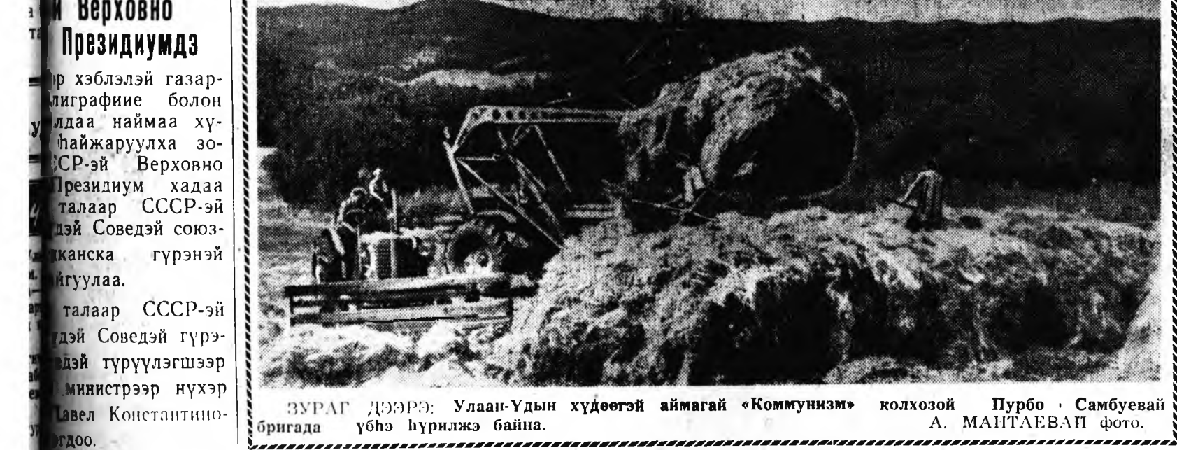
ЗУРАГ ДЭЭРЭ: Улаан-Удын хүдөөгэй аймагай «Коммунизм» бригада үбнэ хүрнлэжэ байна.