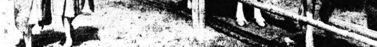
НОВОСИБИРСКОЕ ОБЛАСТЬ. Новосибирскэ үйлдэбэрини управленин Лениной нэрэмжэтэ колхоз жэл бүхэндэ 11 мянган гаран центнер һу, 2 мянган гаран центнер яхы гүрүндэ худалдадаг. Зүнай сагта эбэртэ бодо малаа зуналдаа гаргада. Тус колхозой эрхэн хаалинд 6 нарын туршида үнээн бүриһөө мянган, мянга гаран килограмм һу наагаа байна. Зураг дээрэ: Лениной нэрэмжэтэ колхозой зуналдаа.

Түүхэтэ долоон жэлэй табда дахи жэлдэ тус фермын коллектив бүри эхэ зорилгоонуды урдаа табта. Тоо барим