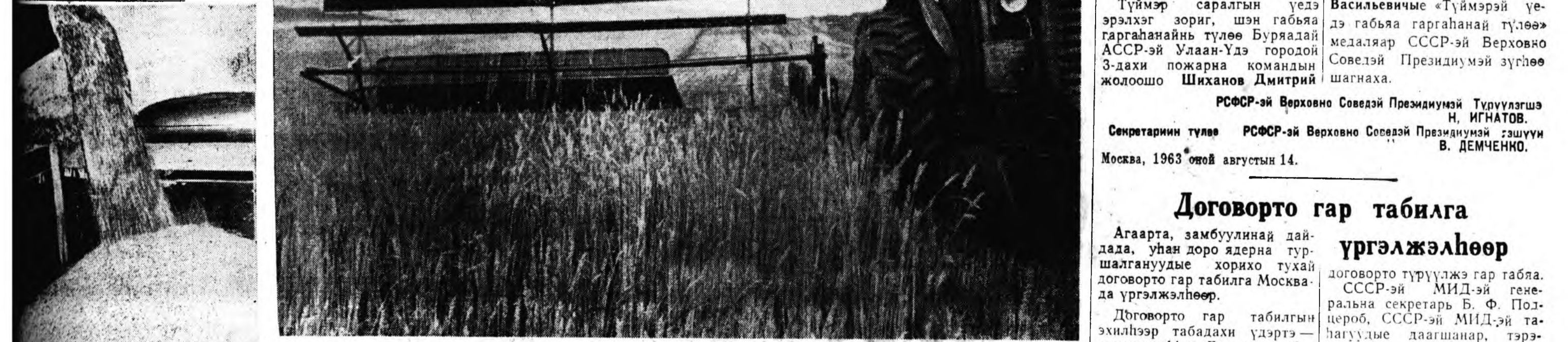
Мухар-Шабарэй үйлэдбэрийн управлени мүнөө жэлдэ 2,5 миллион пүүд ороһоо тарьяа гүрэндэ худалдаха гэжэ республика соогоо нэн түрүүлэн патриотическа үүсхэл гаргаа юм. Тус управленин Бэшуурэй совхозой тарьяашад августын 12-то тарьяага хуряажа ахилба. Мүнөө тэндэ 100 гектар тарьяан хадгалдаг байна. Зураг дээрэ (зүүн гарһаа): 1. Түрүүлшын ороһон буннерһаа нувоо руу адхарна захалаа. 2. Бэшуурэй совхозой 3-дахи отделегиин «ЖБ-4,6» лафетиз жатка хүтэлһэн транзисторист Леонид Андеев совхоз соогоо түрүү нуури эзэлнэ.