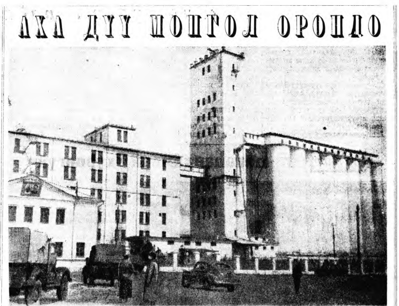
МОНГОЛ АРАДАЙ РЕСПУБЛИКА. Советскэ Союзай гүһалжжаар Улаан-Баатарта ба- ригданан талха татадаг комбинат.

Буряадышье үхүбүүд ород үгтэе буряадшалан хазагай хэлэжэ занша- шаха, ородшье үхүбүүд буряад хэлэ мүн тэршэлэн хэрэглэха ушар га- радаг. Тимэһээ нима байдалда эхин классай, дээдшье классай багша- нар онсо анхарал хандуудха зэргэ- тэй. Цонто Номтоев, РСФСР-эй габьяат багша, поэт. Буряад хэлэнэй мэдэрэл дээрэ