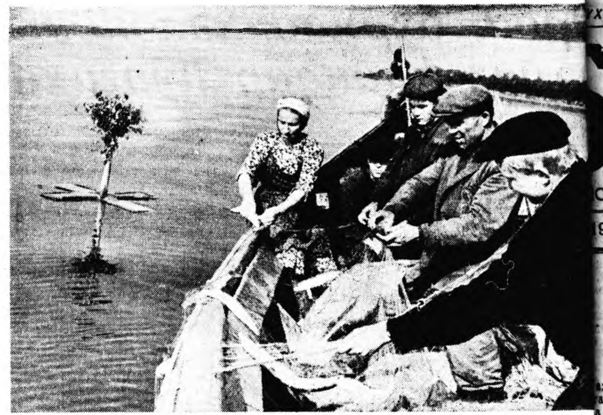
БАЙГАЛАН ЗАГАШАДА. Ф. СОРОКИНОЙ

КПСС-эй Буряадай обкомой соёл сурталдай тагауудай гаргадаг Агитаторай блокнотой ээлжэжэ — 14-дхи номер наяхан хэблэлээ гараба.