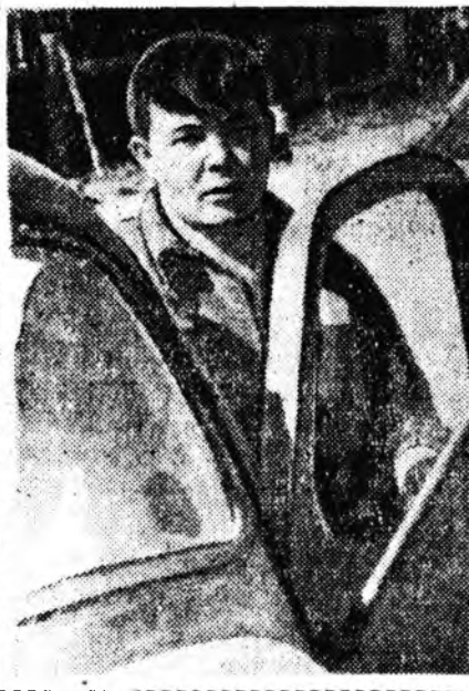
Хүдэлмэрин 14 үдэртэ

Хатаһан баалнууды суглуу-лан сохилгодо дүрбэн «СК-3» комбайн хүдэлнэ. Энэ дүй дүр-