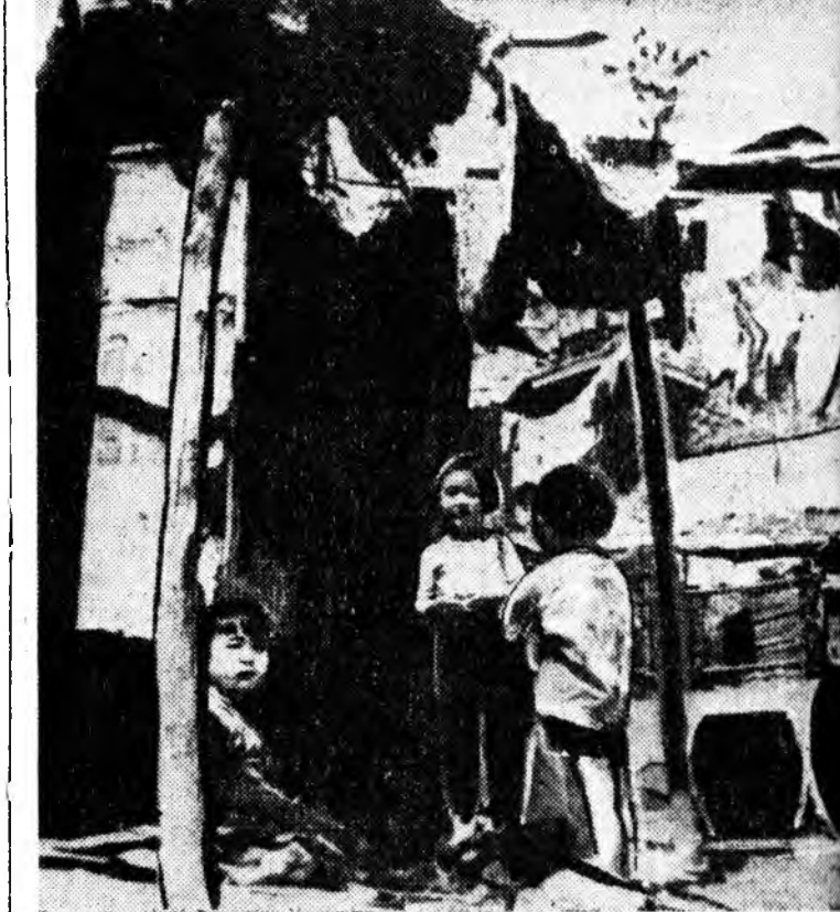
Сеульска хэлбэлэй мэдэрһээр, Урда Корейдэ гэр байра эхээр дугалдана. Зураг дээрэ: Сеул городто ажануудад үгыгынгуулол байра.

ГААГА, сентябрийн 2. (ТАСС). Генетикын талаар улаасхорондын XI конгресс мүнөөдэр Схевенингендэ нээгдэ. 52 ороной 1500 гаран үргэлжэлэхэ.