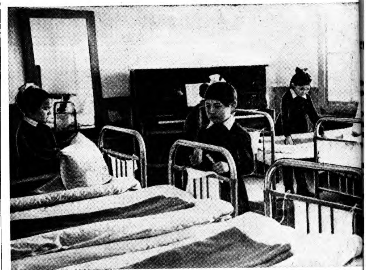
Хуралсалал шэнэ жэл эхилхээр хэлэн хоног үнгэрбэ. Хурагшад түрэл кластай, хамтынгаа байрын таһалгалуудта бусажа, эрдэм номойгоо замда орубо. Хурамхаанай интернат-хургуулинхид зунайнгаа амаралтыг хүхюунээр үнгэрбөөд, байл түрэл классуудтаа бусэ Зурга дээрэ: Хурамхаанай интернат-хургуулин хурагшад хамтынгаа байр соо үглөөгүүр эртэ болодо, орон шэрэгээ заажа байна.